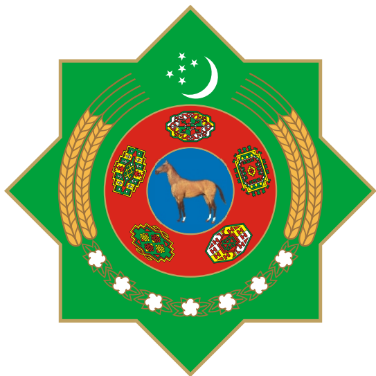
TÜRKMENISTANYŇ DÖWLET TUGRASY