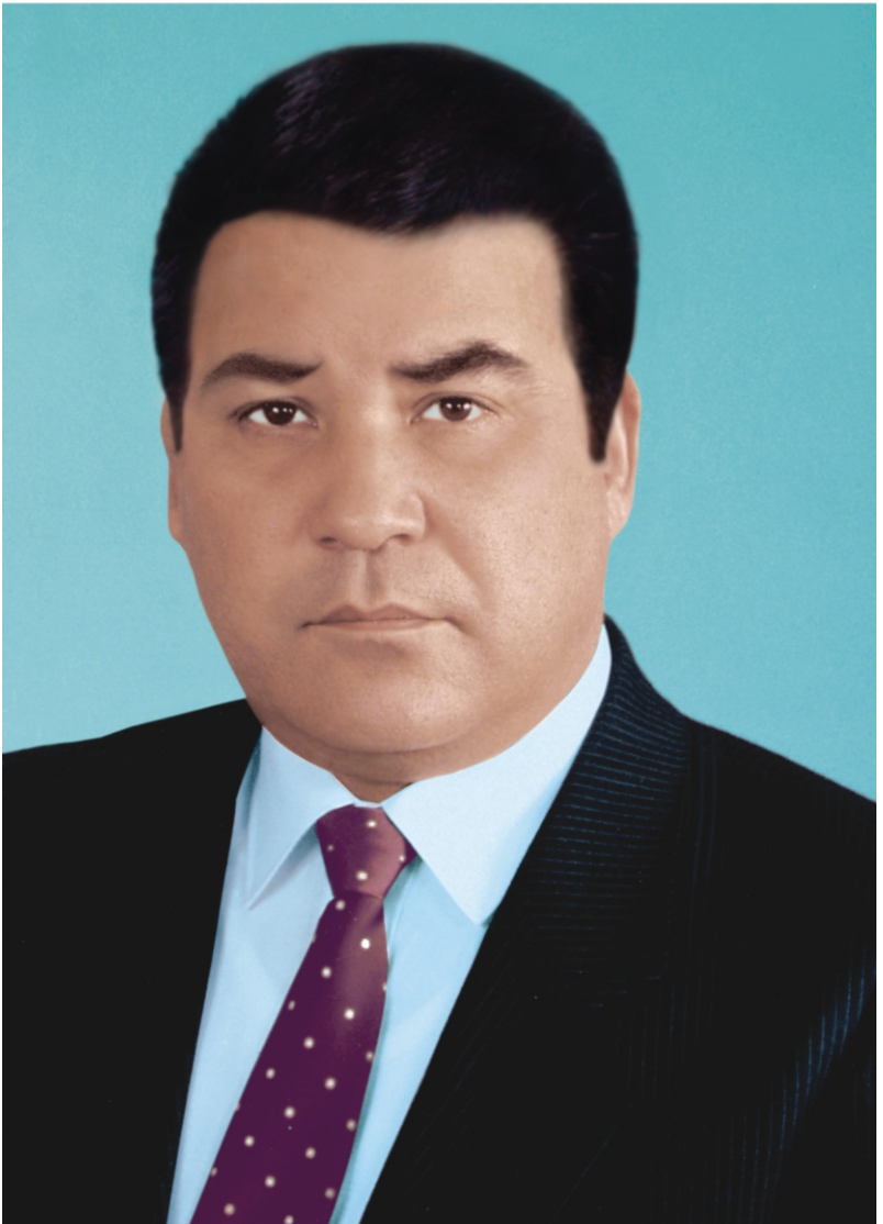
TÜRKMENISTANYŇ ILKINJI PREZIDENTI BEÝIK SAPARMYRAT TÜRKMENBAŞY