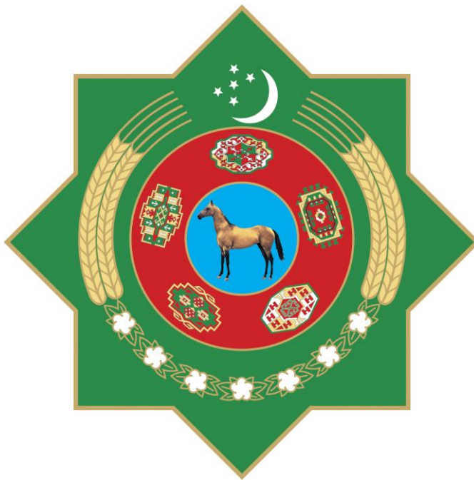
TÜRKMENISTANYŇ DÖWLET TUGRASY