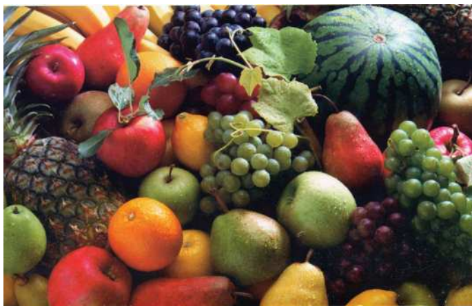
Ýokumlyklaryň çeşmesi – miwe önümleri

Hyýaryň miwesinde azotly we azotsyz maddalar, kletçatka, mineral maddalar, kaliý, natriý, kalsiý, magniý, fosfor, A witamin 0,08-0,28 mg, 0,06 mg, B 2 0,22 mg, C 4,1-14 mg bardygy anyklandy. Hyýaryň tohumlaryndan gaýnadylyp alynýan şire naharyň ýanynda içilýär we ol buşukdyryjy serişdedir. Gök hyýaryň gabygy ýüzüň tämizlenmegine kömek edýär.