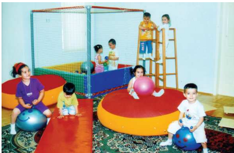
Körpeler bedenterbiýe otagynda