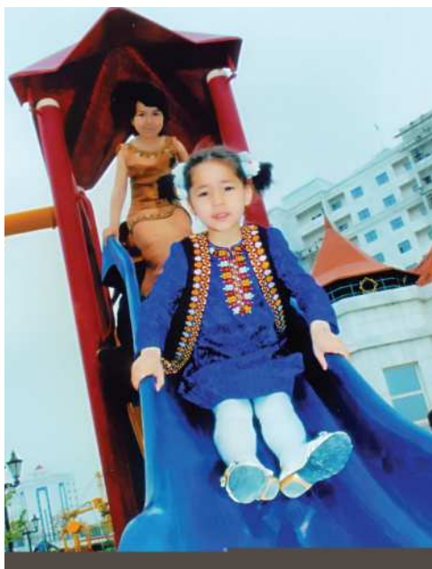
Körpeler oýun meýdançasynda

Çagalar bagynyň meýdançalary hemmetaraplaýyn enjamlaşdyrylyp, typançaklar, basgançaklar, ýoljagazlar ýerleşdirilmelidir.