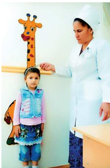
Körpäniň boýunyň ölçenilişi

hem möhüm çäreleriň biridir. Ata-eneler, terbiyeçiler, mugallymlar, çaganyň her bir ýaş döwrüne görä, oňa durmuşyň gowy taraplaryny öwretmek arkaly şahsyýeti kemala getirmelidirler. Çagada 2-3 ýaşda özbaşdak bolmaga isleg döreýär. Şonuň üçin hem çagany özbaşdak hereket etmäge gönükdirmek, goldamak, ösdürmek zerurdyr. Çagalar bagynda şeýle häsiýet yzygiderli öwredilmelidir. 2-3 ýaşdaky çagalara nahar başynda edepli oturmak, nahary dökmän-saçman iýmek, çemçäni sag elinde tutmak, nahar başyndan diňe iýip bolandan soň turmak, öz oturgyjyny emaç bilen süý-