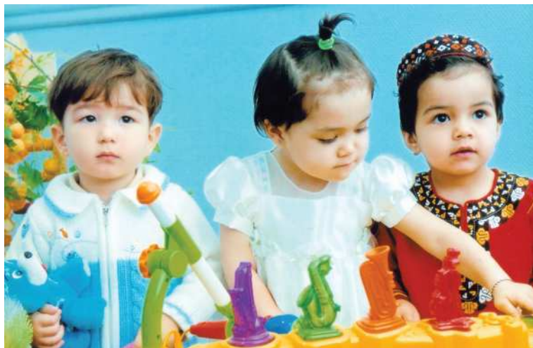
Körpeler özbaşdak oýun pursatynda

Öwrenişmeklik ilkibada işdäden başlanýar. Uky kynrak ýola düşýär, 2-3 hepde, käwagt 2-3 aýa hem çekýär, esasan, çaganyň emosional ýagdaýy uzak saklanýar. Bu zatlaryň esasy görkezijisi çaganyň ýaşyna görä gün tertibi bilen baglanyşyklydyr.