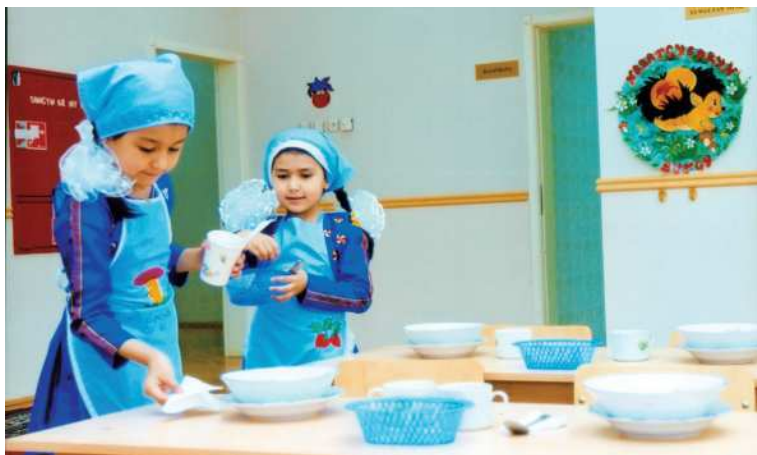
Nobatçylar nahara taýýarlyk görýärler

ýaly kitapça, beýlekisine stoluň üstünde oýnalýan oýnawaçlary, ýene birine surat çeker ýaly kagyz we galam berýärler. Uly ýaşdaky toparyň çagalary terbiýeçiniň kömegi bilen tebigat burçundaky gülleri suwarýarlar, janly burçdaky haýwanlara seredýärler. Körpeleriň ýygnyňyşýan wagtlarynda kitapçalara we suratlara seretmek, gysgajyk söhbetdeşlik geçirmek, stoluň üstünde guralýan oýunlary oýnamak hem-de goşgulary gaýtalamak olar bilen guralýan in gowy terbiýeçilik işleriň biridir. Oýun gutarandan soň, terbiýeçi oýnawaçlary çagalaryň özläriniň tertipli edip ýygnamaklaryna, nobat boýunça howlukman, goh-galmagalsyz ýuwunmaklaryna gözegçilik etmelidir. Çagalar ýuwnanlaryndan soň, saçlaryny darap, eşiklerini tertipleşdirip, ondan soňra otaga girip ertirlik nahar edinýärler.