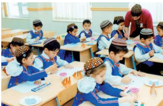
Körpeler sapak wagtynda

Sapaklar çagalar bagynda körpelere yzygiderli bilim bermegiň esasy görnüşidir. Çagalaryň özleşdirmeli täze bilimleri, endikleri we başarnyklary çagalar bagynda bilim we terbiýe bermegiň maksatnamasy esasynda alnyp barylýar. Çagalary akyl taýdan ösdürmekde sapaklaryň ähmiýeti örän uly bolup, körpeler gündelik geçilýän sapaklaryň kömegi bilen akyl-ahlak taýdan hem terbiýelenýärler. Sapaklar mekdep ýaşyna ýetmedik körpeleri mekdep okuwyna taýýarlamak işiniň hem esasy görnüşleriniň biridir. Mekdebe çenli ýaşly körpeler bilen çagalar bagynda guralýan sapaklar çagalary mekdepde okatmakdan özüniň mazmuny, guralyşy, görnüşü we usullary bilen tapawutlanýar. Sapaklaryň üsti bilen körpelere bilim bermekde terbiýeçiniň roly uludyr.