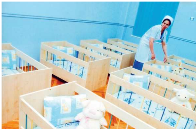
Kiçi ýaşly körpeleriň ýatýan otagy

bolmalydyr. Ol wagtal-wagtal şemalladylyp durulmaly. Şeýle bolanda ertir ir bilen, heniz yssy düşmäňkä, otagyň howasyny gowy edip çalşyrmalydyr. Uky wagtynda arassa howa girip durar ýaly mümkinçilik döredilmelidir.