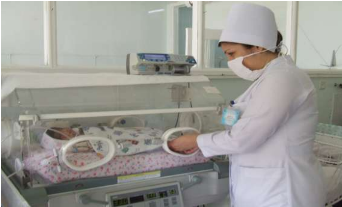
143-nji surat. Ýöriteleşdirilen kýuwezlerde wagtyndan ön doglan çagalara ideg edilişi

Çaganyň agramy artyp başlandan, daşky gurşawyň howasy 25-26 °C deň bolanda beden temperaturasyny belli bir kadada saklap bilenden soňra, ol adaty düzgüne geçirilýär.