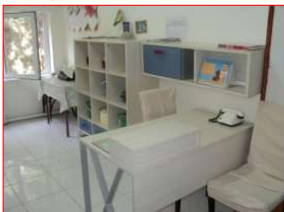
Şepagat uýasynyň posty