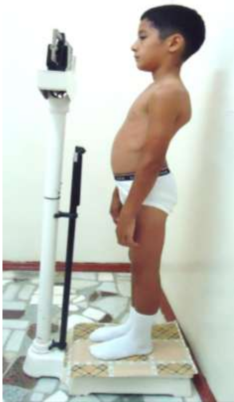
9-njy surat. Uly ýaşly çagalaryň agramynyň ölçenilişi

Üç ýaşdan uly ýaşly çagalaryň agramlary ýöriteleşdirilen dik, dogrulygy \pm 50 gr deň bolan wertikal terezilerde çekilýär. Uly ýaşly çagalaryň agramynyň çekiliş usullary kiçi ýaşly çagalaryňky bilen birmeňzeşdir (9-njy surat).