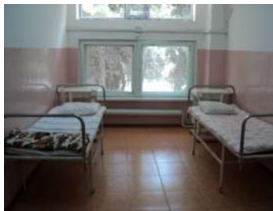
Näsaglaryň ýatýan otagy