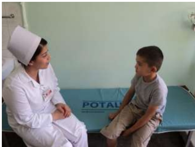
Lukmanyň näsag çaga bilen söhbetdeşligi

Lukmançylyk işgärleri hasam, şepagat uýalary näsag çaganyň gylyk häsiýetine görä hereket etmeli, ýagny örän mylakatly bolmaly, olaryň çekýän agyrlaryna, ejirlerine duýgydaşlyk bildirmeli, sabyrly, geçirimli bolmaly. Bölümdäki hemme çagalara deň göz bilen garamaly, şol bir wagtda bolsa olaryň her biriniň individual aýratynlyklaryny öwrenmeli we nazarda tutmaly.