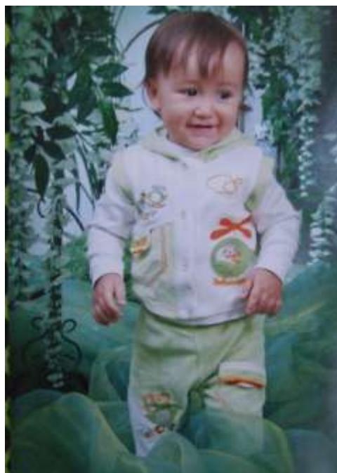
20-nji surat. 1 ýaşly çaga

3 ýaşynda - çagajyk öz jynsyny (gyzjagazdygyny ýa-da oglanjyklygyny) aýdyp bilýär, üç-dört sany gaýtalap sanaýar. Suratdaky predmetleriň, öz adyny aýdyp bilýär. Bökmäni, tans etmäni, yzlygyna ýöremäni, basganjakdan aşak düşmäni, üç tigirli welosipedi sürmäni başarýar. Monjuklaryny düzmäge, surat çekmäge synanyşýar, düşegine buşukmasyny goýýar.