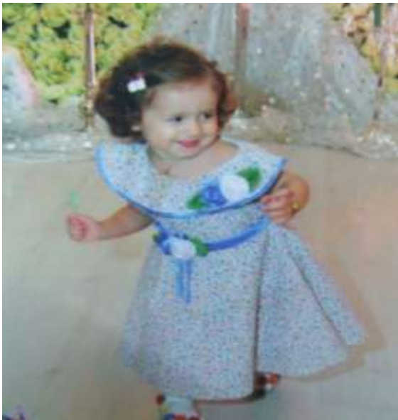
21-nji surat. 2 ýaşyndaky çaga