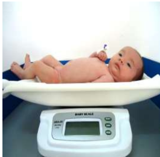
8-nji surat .Kiçi ýaşly çagalaryň agramynyň ölçenilişi.

Şepagat uýasy tereziniň öň ýanynda durup sag eli bilen çekuw daşlaryny eýläk – beýläk süýşürmeli, çep eli bilen bolsa çaga ýykylmaz ýaly ony gaty basman saklamaly. Çaganyň agramy çekilenden soň tereziniň dilini ýapmaly we çagany tereziden düşürmeli, alnan netijäni bellemeli. Her çaga çekilenden soňra tereziniň hemme ýeri 1% hlor ergini bilen arassalanmaly. 3 ýaşa çenli çagalaryň agramy görterijiligi 19 kg.deň bolan adaty ýa-da elektron terezilerde