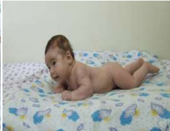
18-nji surat. 3 aýlyk çaga

1 aýlyk - çaga nazaryny haýsy hem bolsa bir zada dikýär, gymyldaýan, hasam ýagty predmetiň hereketlerini synlaýar, garnyna ýatyrsaň biraz wagtlap (birnäçe sekundyň dowamynda) kellesini dik saklamany başaýar,