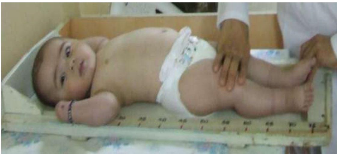
6-njy surat Kiçi ýaşly çagalaryň boýynyň ölçenilişi

plankany caganyň dabanyňa tarap süýşürmeli. Ýokary we aşaky plankalaryň arasy caganyň boýuna gabat gelýär (6-njy surat).