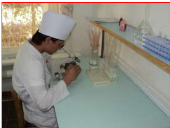
Labarotoriýa barlagynyň geçirilişi