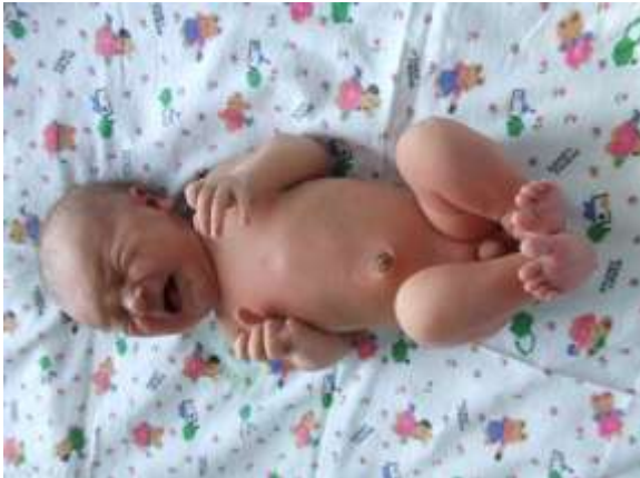
17-nji surat. 2 günlük çaga

Ýetik, wagtynda doglan bäbeğiň epiji myşsalarynyň tonusynyň ýokarydygy sebäpli, onuň hereketleri sazlaşyksyz, tertipsiz (atetoz) ekstrapiramida häsiýetli. Bäbek düşekde ýatanda onuň elleri-aýaklary epilen ýagdaýda (flexo) bolýar (17-nji surat). Bäbek aýyganda aglaýar, onuň agyry we temperatura gyjyndyryjylara jogap reaksiýasy döreýär. Gülip bilenok, görýär, emma ýagtylygyň hereketini yzarlap bilenok, göz ýaş bölünip çykanok.