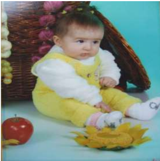
19-njy surat. 6 aýlyk çaga

6 aýlyk - hereket edýän predmetleri tutup, ellerinde saklap bilýär. Aýna hezil edip seredýär, öz-özi bilen “gürleşýär”, özüni gurşap alýan hemme ýakyn adamlaryny gowy tanaýar, del adamlardan ýadyrganýar. Goltgy berseň oturýar, käbir halatlarda özbaşdak oturyp bilýär, oýunjaklary bilen oýnaýar, arkanlygyna ýatyrsaň gapdala togalanmagy başarýar (19-njy surat).