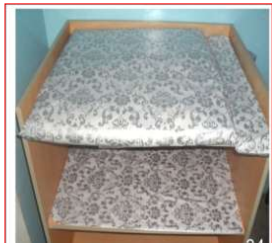
Kiçi ýaşly çagalaryň Gundalýan stoly