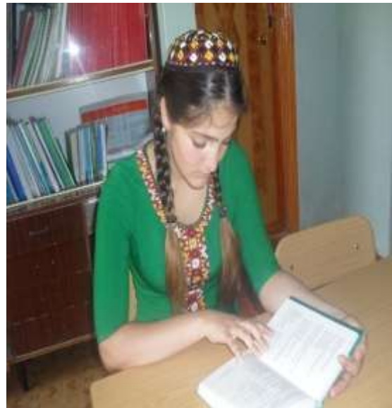
22 – nji surat. Uly mekdep yasly döwür. 15 yasly çaga

4 ýaşynda - dörde –bäşe çenli dogry sanap bilýär, suratdaky çyzylan haýwanlaryň atlaryny bilýär, gyzykly okalýan ertekileri hezil edip diňleýär, ululara dürli soraglary berýär, surat çekip bilýär.