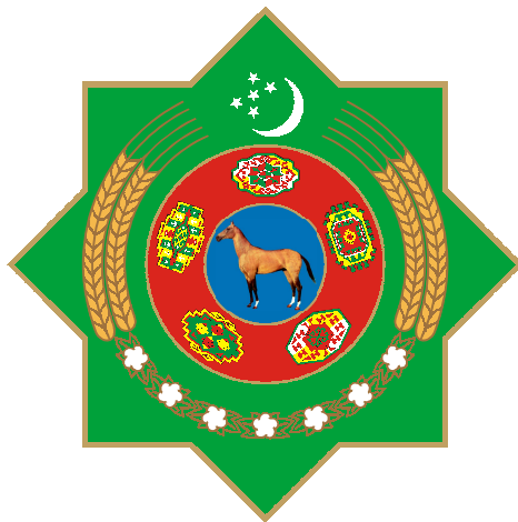
TÜRKMENISTANYŇ DÖWLET TUGRASY