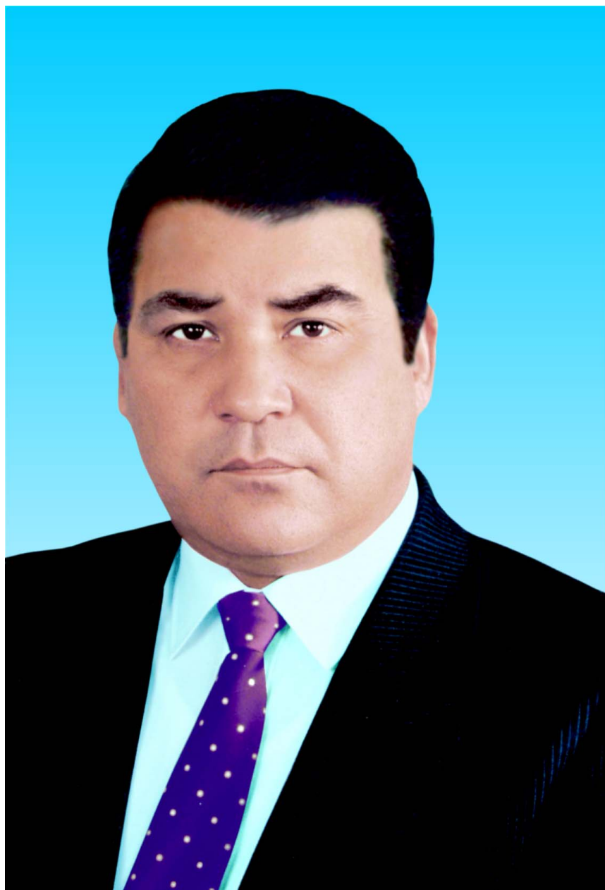
TÜRKMENISTANYŇ ILKINJI PREZIDENTI BEÝIK SAPARMYRAT TÜRKMENBAŞY