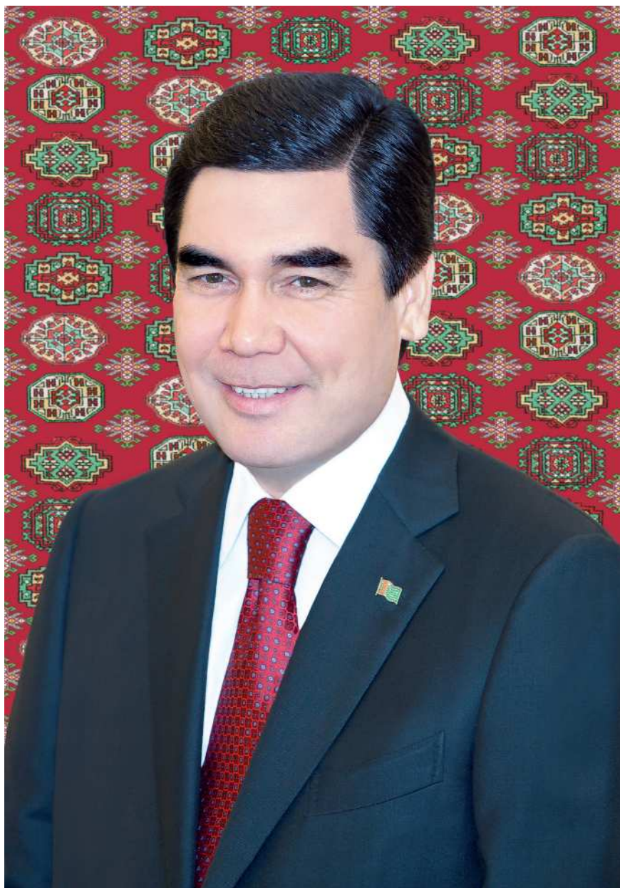
ПРЕЗИДЕНТ ТУРКМЕНИСТАНА ГУРБАНГУЛЫ БЕРДЫМУХАМЕДОВ