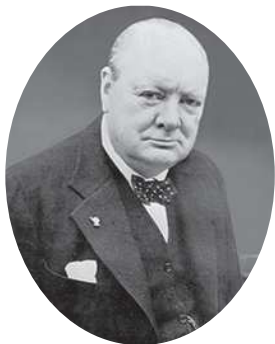
Уинстон Черчилль (30.11.1874–24.01.1965)

Сэр Уинстон Леонард Спенсер-Черчилль – британский государственный и политический деятель, премьер-министр Великобритании в 1940–1945 гг. и 1951–1955 годах, военный, журналист, писатель, лауреат Нобелевской премии по литературе (1953 г.), сэр.