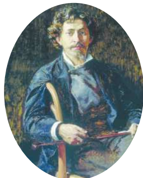
Илья Ефимович Репин (1844–1930)

Неверие в собственную исключительность и гениальность , в своё первенство осталось в нём навсегда . Он любил называть себя «посредственным тружеником», и ежедневным каторжным трудом отрабатывал своё громкое имя. Удачи не сделали его небожителем , а неудачи не озлобляли. Поступив в желанную Академию художеств, он делает стремительные успехи. И неудивительно : он приехал в Петербург уже мастером, профессионалом , услугами которого охотно пользовалась вся чугуевская округа.