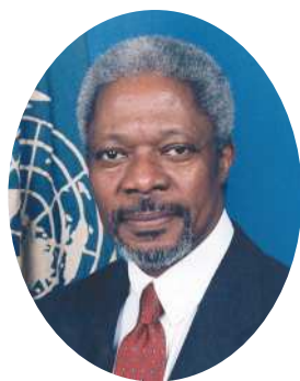
Кофи Аннан (Род. 08.04.1938)

10 декабря 2001 года Генеральный Секретарь и Организация Объединённых Наций были удостоены Нобелевской премии