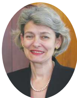
Ирина Георгиева Бокова (Род. 12.07.1952)

После отставки Ирина Бокова активно продолжала заниматься общественной деятельностью, возглавив созданный ею