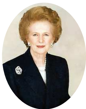
Тэтчер Маргарет Хильда (13.10.1925–08.04.2013)

Премьер-министр Великобритании (1979–1990 гг.). Родилась 13 октября 1925 г. в Грантеме (графство Линкольншир) в сем...е бакалейщика. Закончила Оксфордский университет в 1947 г. В 1953 г. получила юр...дическое образование, вела адвокатскую практику, сп...циализировалась на делах, связа...ых с налоговым правом.