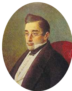
«А.С. Грибоедов» работы И. Крамского, 1873 г. (1795–1829)

В январе 1826 г. арестован в крепости Грозная по подозрению принадлежности к декабристам. Со многими из декабристов А.С. Грибоедов был знаком лично, одобрял их цели, но к перспективе заговора относился скептически. Грибоедов был привезён в Петербург и сумел доказать непринадлежность к тайному обществу.