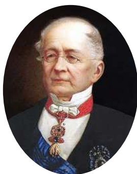
Александр Михайлович Горчаков (1798–1883)

Горчаков Александр Михайлович, князь, знаменитый дипломат, с 1867 г. Государственный канцлер, родился 4 июля 1798 г.; получил воспитание в царскосельском лицее, где был товарищем А.С. Пушкина. В юности «питомец мод, большого света друг, обычаев блестящих наблюдатель» (так характеризовал его А.С.Пушкин в одном из посланий к