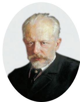
Петр Ильич Чайковский (1840–1893)

Считается одним из крупнейших композиторов в истории музыки. Автор более 80 сочинений, в том числе 10 опер, 3 балетов. Его концерты и другие произведения для фортепиано, семь симфоний, четыре сюиты, программная симфоническая музыка, балеты «Лебединое озеро», «Спящая красавица», «Щелкунчик» пред-