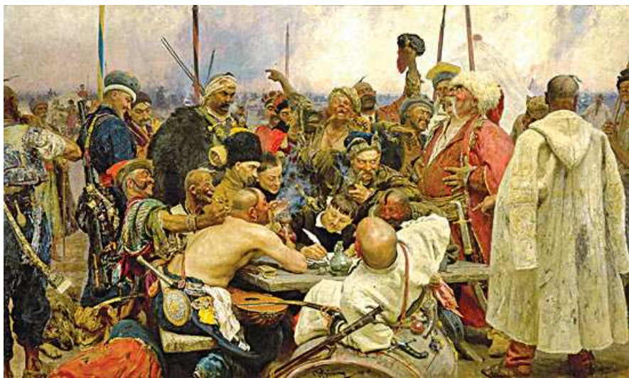
И. Репин. Запорожцы пишут письмо турецкому султану. 1878–1891 гг.

«Я, султан, сын Мухаммеда, брат Солнца и Луны, внук и наместник Бога, владелец царств Македонского, Вавилонского,