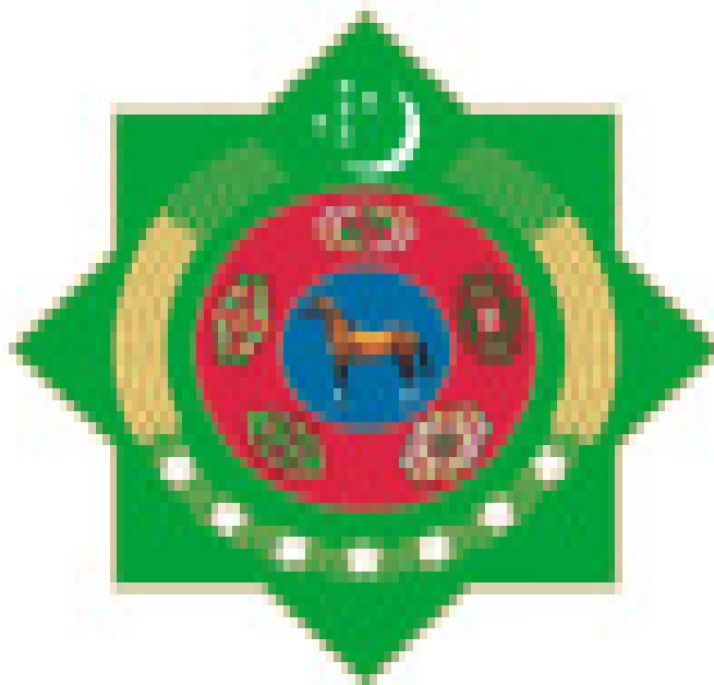
TÜRKMENISTANYŇ DÖWLET TUGRASY