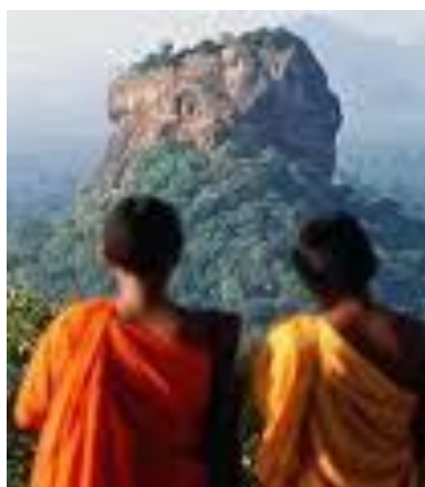
Gündogar we Günorta-Gündogar Aziýanyň gadymy ýadygärlikleri