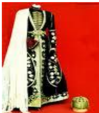
Kawkaz milli egin-eşikleri