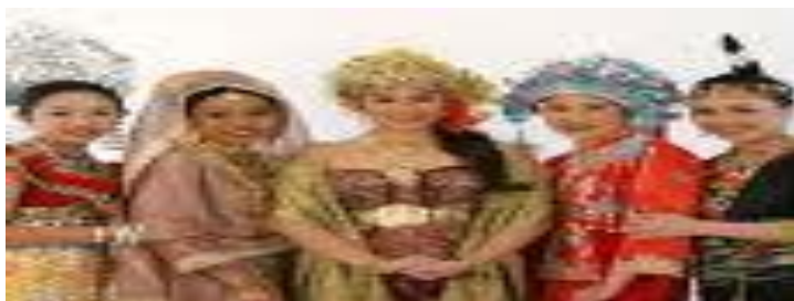
Merkezi Aziýanyň gadymy we häzirki zaman milli egin-eşikleri