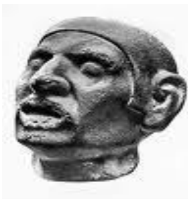
Astek esgeriň heýkeli