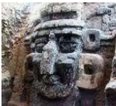
Dag ýüzünde maýa heýkeli