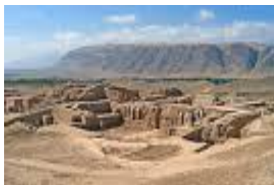
Türkmenistanyň gadymy ýadygärlikleri