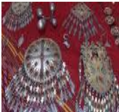
Türkmen milli şay-sepleri