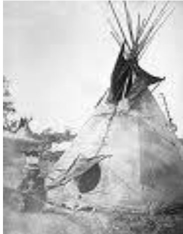
Indeý „tipi“ öýi