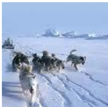
Birnäçe it goşulan eskimos ulagy