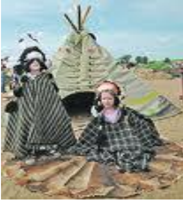
Indeýler milli eşiginde