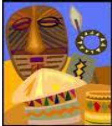
Afrika sanatlerinin görünüşleri