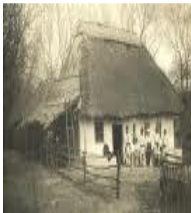
Gadymy ýewropa jaýlary