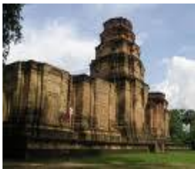
Günorta – Gündogar Aziýadaky gadymy ýadigärlik