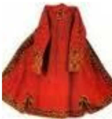
Türkmen milli aýal egin-eşikleri