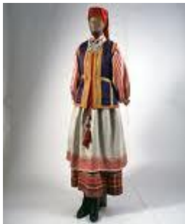
Ýewropa milli eşikleri