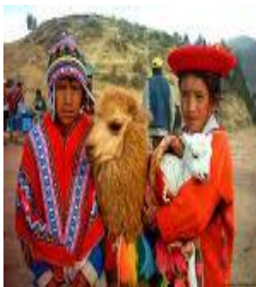
Gadymy inkleriň nesilleri