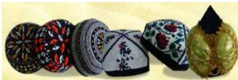
Merkezi Aziýa halklarynyň başgaplary