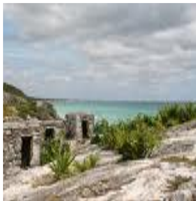
Gadymy maýalaryň jaýlary