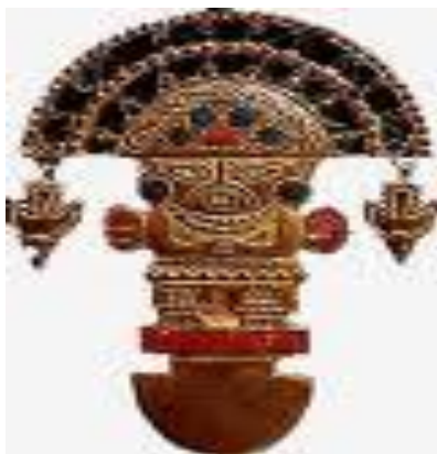
Ink hudaýynyň şekili