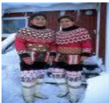
Eskimos aýallary milli eşiginde