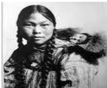
Eskimos aýaly. XX a. başy