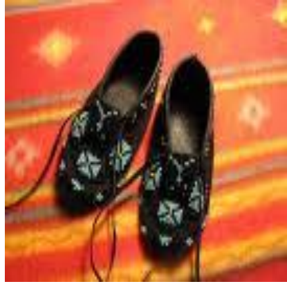
Indeý "mokasin" aýakgaby