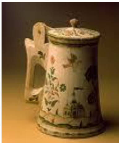
Ýewropa senetleriniň görnüşleri