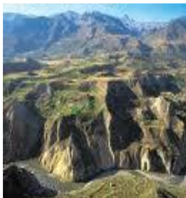
Inkleriň ýaşan ýerleri