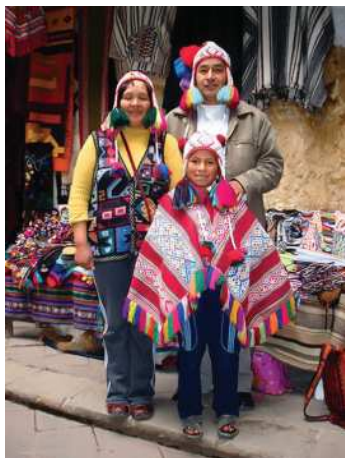
Gadymy inkleriň nesilleri

dir. Külalçylygy bilmeseler hem, inkler elde ýokary hilli gaplary ýasapdyrlar we olary nagyşlapdyrlar, palçykdan heýkelleriň şekillerini döredipdirler. Pagta we ýüň matalary dokamaklyk ýokary derejede bolupdyr. Ink döwrüniň arhitekturasy şu günki günde hem daşlary işlemekde täsin usullary bilen haýran galdyrýar.