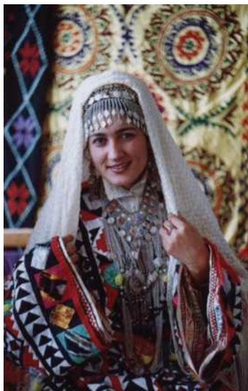
Täjik zenany milli egin-eşikde

Türkmen toý däp-dessurlary ýörite etnologik ylmy edebiýatlarda giňden beýan edilýär. Olaryň öwrenilmegi türkmenleriň etniki taryhynyň wajyp meselelerini aýdyňlaşdyrmak üçin uly ähmiýeti bardyr.