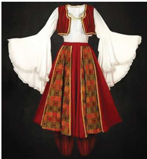
Ýewropa milli zenan eşiği

Ýewropanyň halklary (Günbatar, Merkezi Günorta). Günbatar Ýewropanyň 58-e golaý halklary, esasan, indoýewropa maşgalasyna degişli dillerde gürleýärler. Birinjisi, german topany 17 halky birikdirýär. Ikinjisi, roman topany 15 halkdan ybarat. Slawýan dil topany 11 halky birleşdirýär. Kelt dil topany 4 halkdan ybarat. Grekler we albanlar bir dil toparyna degişli. Finnler, saamlar we wengrler (madýarlar) finnougor toparyna degişli. Altaý dil maşgalasynyň türk toparyna Ýewropa böleginiň türkleri we Moldawiýanyň gagauzlary degişli. Semit dil maşgalasyna Malta adasynyň ilaty degişli. Ispaniýanyň basklarynyň dili dil maşgalalarynyň birine-de degişli dälidir.