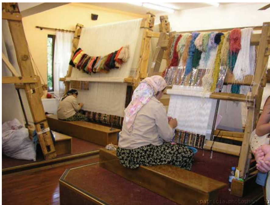
Türk halyçy zenanlary

Bu ýurtlarda dürli öý jandarlaryny we guşlaryny ösdürip ýetişdirýärler. Düyeler, esasan, Arap ýarymadasynda idedilýär. Eýranda, Owganystanda, Türkiýede, Günbatar Aziýanyň çöllerinde, ýarymçöllüklerinde we daglarynda çarwa hojalyk–medeni görnüşi ýaýrapdyr. Ol öz düzümine çarwa, ýarym çarwa we ýarym oturymly maldarçylygy jemläpdir. Häzir bu görnüşleriň gerimi azaldy, olar bilen araplaryň bir bölegi, puştunlar, kürtler, buluçlar, ýarymçarwa ýürükler meşgullanýarlar. Arabystanyň beduinleri esasy bir örküçli