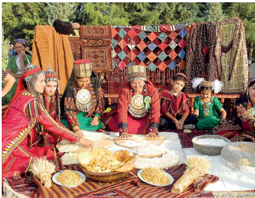
Türkmen toýuna taýýarlyk

mek, geňeş, üme, gyzýygyn, gelnalyjy, gapy tutmak, seçgi seçmek, yhymmyl aýtmak, gelni garşylamak, nika gyýmak, gelin salamy, baş salmak, gaýtarma, giýew çagyрма ýaly türkmeniň ata-babalarymyzdan gelýän, gözüniň göreji ýaly saklanýan asyllý toý däpleri bardyr.