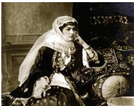
Ermeni zenany. XIX asyryň suraty

Dagystanda türk diliniň gypjak şahasyna degişli dilde kumyklar gürleýärler. Bu dilde şeýle-de iki garyndaş halklar- Kabardin - Balkariýada ýaşaýan balkarlar we Garaçay-Çerkesiýada ýaşaýan garaçaylar gürleýärler. Demirgazyk Dagystanda, Strawropol ülkesinde ýaşaýan nogaýlar hem türk dillilerdir. Stawropol ülkesinde türkmenleriň uly bolmadyk etnik topary ýaşaýar. Kawkazda indoýewropa dil maşgalasynyň eýran dillerinde gürleýän halklardan osetinler, Azerbaýjanda talyş we tat, şeýle-de kürt halklary ýaşaýarlar.