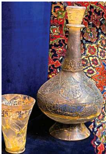
Eýranyň senetçilik önümleri

Has ýaýran erkek eşigi giň, ýeňli köýnekden we balakdan, dondan ýa-da plaşdan ybarat. Gyşda goýun derisinden possun geýýärler. Türk daýhanlary köýnegiň üstünden nah ýeňsiz ýa-da kurtka geýýärler. Puştun erkekleri eşigini ak ýa-da çal reňkdäki, eliňi çykarmak üçin