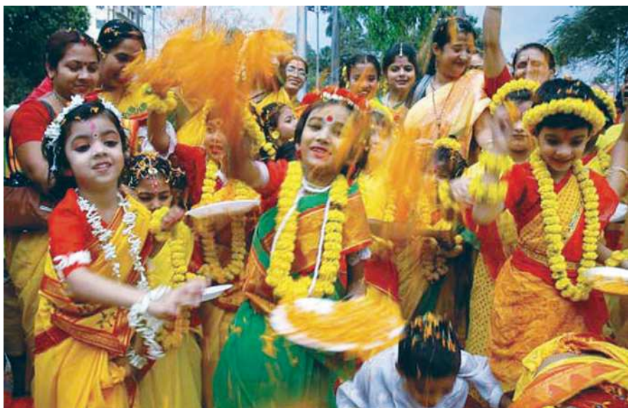
Holi reňkler baýramçylygy

de esaslanan katakali hindi teatry, gurjak teatry giňden bellidir. Her baýramçylykda tans edilýär, aýdym aýdylýar. Gözbagçylaryň görkezýän oýunlary ilat arasynda gowy görülýär.