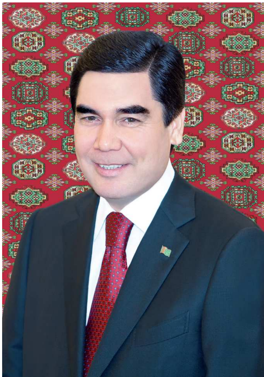
TÜRKMENISTANYŇ PREZIDENTI GURBANGULY BERDIMUHAMEDOW