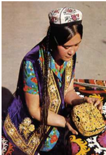
Özbek senetçiliginiň önümleri

göçüp-gonupdyrlar. Wagtyň geçmegi bilen bolsa oturymlylyga geçýärler. XIV asyrdan has irki döwürlere degişli ýazuw çeşmelerinde bu etnonim duş gelýär. XVI asyryň başynda özbekler Horezmde, Zerawşan derýasynyň boýlaryndaky oazislere, Fer-