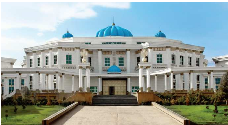
Türkmenistanyň Milli muzeýi

Stasionar etnologik muzeýler bilen bir hatarda soňky onýyllyklarda açyk howada döredilýän etnologik seýilgäh muzeýleriň hem möhüm orny bardyr. Şeýle muzeýler skansen diýlip atlandyrylýar. Bu etnologik muzeýleriň ýygyndylaryny toplamaklygyň esasy bolup, etnosyň adaty durmuşynda ulanylan we şol etnosyň döreden maddy zatlary hyzmat edýär. Häzirki döwürdäki etnoseýilgähler – açyk howadaky muzeýler şeýle zatlar bilen bir hatarda ýaşayyş jaýlaryň we ulaglaryň adaty ölçeginde görkezilmegini göz önünde tutýar. Dünýäde etnoseýilgähleriň 600-den gowragy döredilendir.