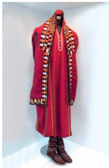
Milli zenan egin-eşigi

Islendik halkyň milli egin-eşikleri asyrlaryň dowamynda döräp, kämilleşip, ýönekeý we şol bir wagtda parasatly biçüwi bilen tapawutlanýarlar, gymmatly estetik hili özünde saklaýarlar. Aýdylanlar doly manysynda türkmen milli egin-eşiklerine hem degişlidir. Adaty egin-eşikleriň biçüwleri uzak döwürleriň tejribesi esasynda döräp, howa şertlerimize uýgunlaşypdyr. Türkmenler gadymyýetden şu günlerimize çenli üýtgemän diýen ýaly ýeten milli egin-eşigini gündeki durmuşda ulanýan dünýäniň seýrek halklaryndan biridir.