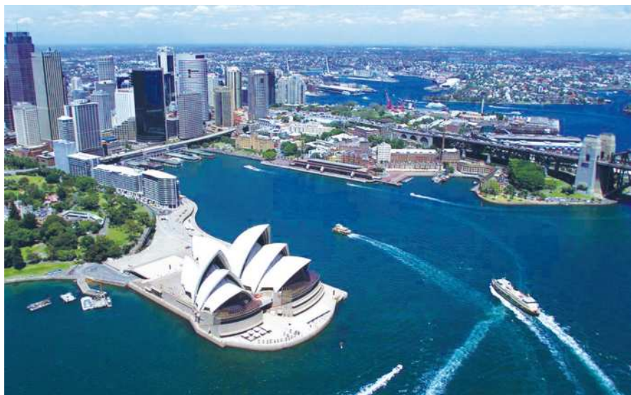
Awstraliýanyň Sidneý şäheri

Awstraliýa we Okeaniýa öňden bəri etnologlaryň ünsüni özüne çekýär. Onuňam sebäbi bu ýerlerde tä soňky döwürlere çenli dünýäniň başga sebitlerinde seýrek duş gelýän hojalygyň, jemgyýet durmu-