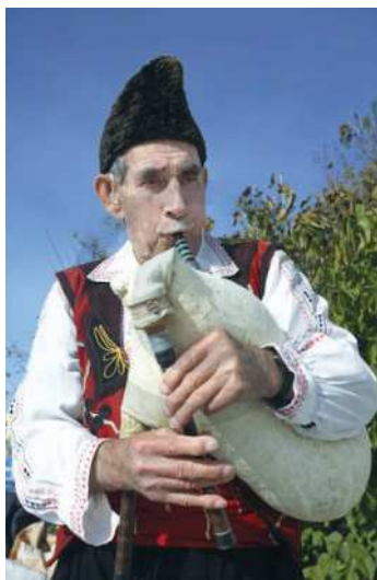
Wolynka saz guraly

Ýaşayyş jaýlary obalarda birnäçe görnüşde: 1-2 gatly daşdan gurulýan jaýlar; ýapyk dörtburçlugy emele getirýän ýaşayyş jaýlar; merkezinde däne saklanylýan howly görnüşinde salynýar. Milli eşikleri: erkekleriňki kelte balak, ak köýnek, kelte kurtka ýa-da ýeňsiz, başgaplary şlýapa ýa-da beret. Aýallaryňky uzyn giň gara ýa-da gök ýubka, nagyşlanan ak öňselik, biline çenli kelte köýnek, ýeňsiz, ýaglyk. Häzirki wagtda umumy ýewropa egin-eşikleri ýaýrandyr. Dini boýunça italýanlar hristianlar-katolikler.