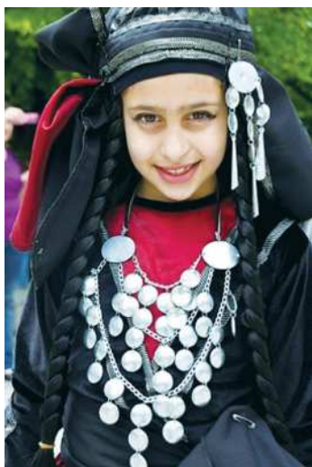
Milli şaý-sepleri dakynan kawkaz gyzy

şeýle-de Alynky Aziýanyň siwilizasiýalaryna ýakynlygy bu ýerde ýaşayan halklaryň medeniýetine öz täsirini ýetiripdir.