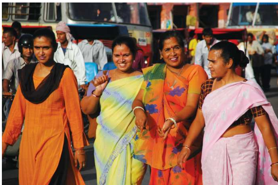
Hindi zenanlary milli egin-eşikde

Günorta Aziýanyň günbatar sebitlerinde çarwa we ýarymçarwa ilaty kem-kemden oturymlylyga geçse-de, suw çeşmeleriniň ýanyndaky wagtlaýyn jaýlarda ýaşayanlar hem az däl. Çarwa puştunlar we buluçlar ýüň galyň matadan ýa-da brezentden örtülen çadyrlarda ýaşaýarlar. Onuň merkezinde ojak bolýar, daşyna haly-palasydyr, örülen düşekçeler ýazylýar. Çadyry saklaýan taýaklarda dürli hojalyk zatlary, çuwallary asyp goýýarlar.