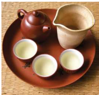
Ýapon çay gap-gaçlary

sürümli ekerançylaryň ara mylaýym zolagyndaky hojalyk-medeni görnüşi ýaýran. Esasy oba hojalyk ekini-şaly. Gök ekinleriň we bagçylygyň orny uludyr. Pagta, ýag alynýan osümlikler, çay köp ekilýär. Hojalyk-medeni görnüşleriniň dördünjisi maldarçylyk. Ol mongol, türki we tungus-mançžur halklarynda ýaýran. Häzirki Mongoliýanyň territoriýasynda baryp b.e. öň I müňýyllykda çarwa maldarlaryň hojalyk-medeni görnüşi döräpdir. Goýunlaryň, atlaryň we az mukdarda iri şahly mallaryň ösdürip ýetişdirilmegi passyllaýyn göçüşliklerde esaslanandyr. Hytaýyň demirgazyk gündogarynda oroçenleriň aýry toparlarynda we ewenklerde sugundarçylyk ýaýrandyr.