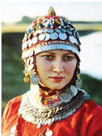
Çuwaş gyzy milli eşikde

agaçdan gurlupdyr, düzlüklerde pag-sadan salnypdyr. Milli egin-eşikleriň öndürilişi öý senetçiliginiň bir görnüşi bolupdyr. Lýon ekilipdir we ondan nah mata dokalypdyr, ýün matalar dokalypdyr, deri eýlenipdir.