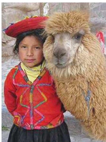
Keçua gyzjagazy lama bilen

Buthanalar ýylmanan daş bloklaryndan suwag ulanmazdan, pyçagyň uýy geçmeýän ýakynlykda salnypdyr. Ýönekeý adamlaryň