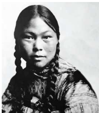
Eskimos zenany. XIX asyryň suraty

Demirgazyk Amerikanyň awçylarynyň – indeýleriň we eskimoslaryň ýaşaýşy tebigy gurşaw bilen iňňän ýakyn bagly bolupdyr. Soňky döwürlere çenli tebigat Demirgazygyň asyl ilatyny azyk, egin-eşik we ýaşaýş jaýlary üçin gerekli zatlar bilen, başga zerur bolan gereklerini üpjün edipdir, olaryň medeniýetleriniň çeşmesi bolup hyzmat edipdir. Köp münýyllyklaryň dowamynda Amerikanyň demirgazygy oýkumenanyň iň daşky ýeri hasaplanypdyr.