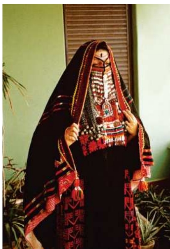
Arap zenany milli egin-eşikde

gyndaky ýerlerde ýerleşipdirler. Arap ýarymadasynda araplaryň ata-babalary mesgen tutupdyrlar. Bu döwürde Alynky Aziýada indoýewropa dil maşgalasyna degişli halklar peýda bolýarlar. Olar Hett döwletini emele getirýärler.