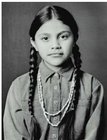
Indeý gyzy. XX asyryň başy

L. Morganyň işlerinden soň irokezleriň sosial gurluşy ene urugynyň özboluşly mysaly hökmünde seredilipdir. Irokezleriň owaçıra diýip atlandyrylýan ene obşinasy bolupdyr. Owaçıra – bu taýpanyň hemme aýallaryny we olaryň çagalaryny (hem gyzlaryny, hem ogullaryny) birikdiripdir. Aýallar üçin owaçıra hemişelik ýaşayan ýeri