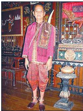
Khmer milli eşiginde

Günorta-Gündogar Aziýanyň ilatynyň köpüsiniň jaýlary dregli. Agaç sütünleri dikeldilýär, olaryň üstüne agaçdan pol ýazylýar, diwarlary we üçegi berkidilýär. Bu döp kenarlarda duran jaýlary suw basmazlygy üçin döräpdir. Jaýlaryň diwarlary we pollary üçin bambuk, palmalaryň sütünleri hyzmat edýär. Üçegi adaty iki taraply göni ýa-da konus görnüşindedir. Palma