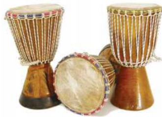
Afrikanyň «tamtam» depleri

Afrikanyň etniki taryhy. Ýokary paleolitde häzirki görnüşli afrikan adamy kemala gelipdir. Niger derýasynyň boýlarynda negroid şekilli gadymy adamyň süňkleri tapyldy. Alžyryň Meşta al-Arbi ýerinde tapylan süňk galyndyla-