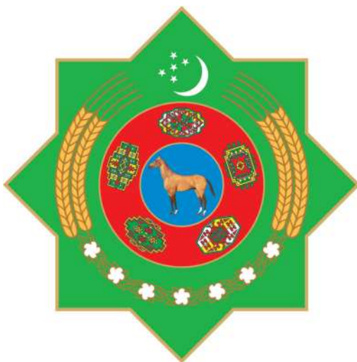
TÜRKMENISTANYŇ DÖWLET TUGRASY