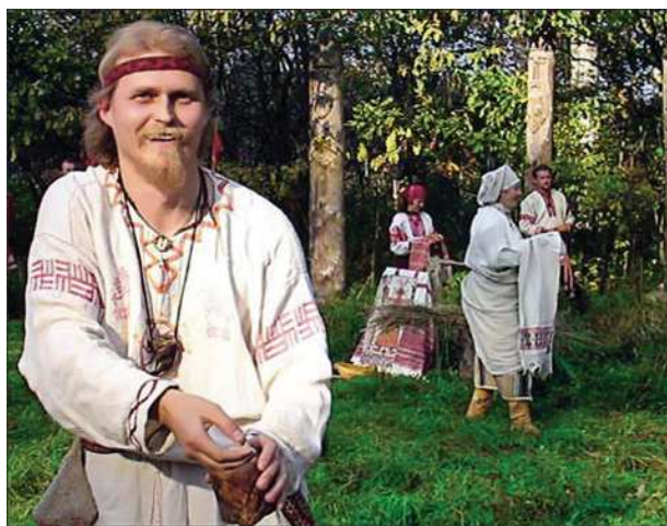
Iwan Kupalanyň baýramçylygynda

Obrok baýramynda ýeriň hasyllygy üçin mal kesilipdir. «Möjek günler» noýabr aýynyň 2-3 hepdesi bolup, onda möjekleri awlamak gadagan bolupdyr. 14-nji fewral bolgarlarda we beýleki günorta slawýanlarda Trifon Zarezanyň günü bellenipdir, onda üzüm gozalary kesilipdir we üzümiň düýbüne «gowy hasyl üçin» çakyr guýlupdyr. Lazaritsa gyzlaryň baýramçylygy Pasha baýramçylygyna bir hepde galanda bellenipdir, mart aýynda Todorow gününde at çapyşyklar guralypdyr. 6-njy maýda Georgiýew günü, ýagny mallaryň ilkinji gezek