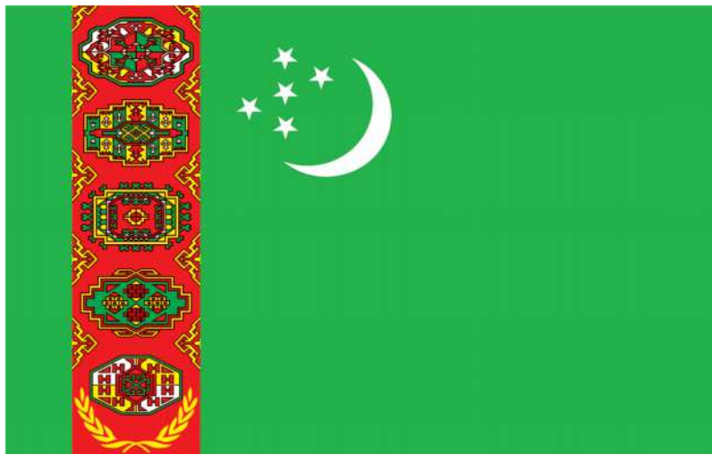
TÜRKMENISTANYŇ DÖWLET BAÝDAGY