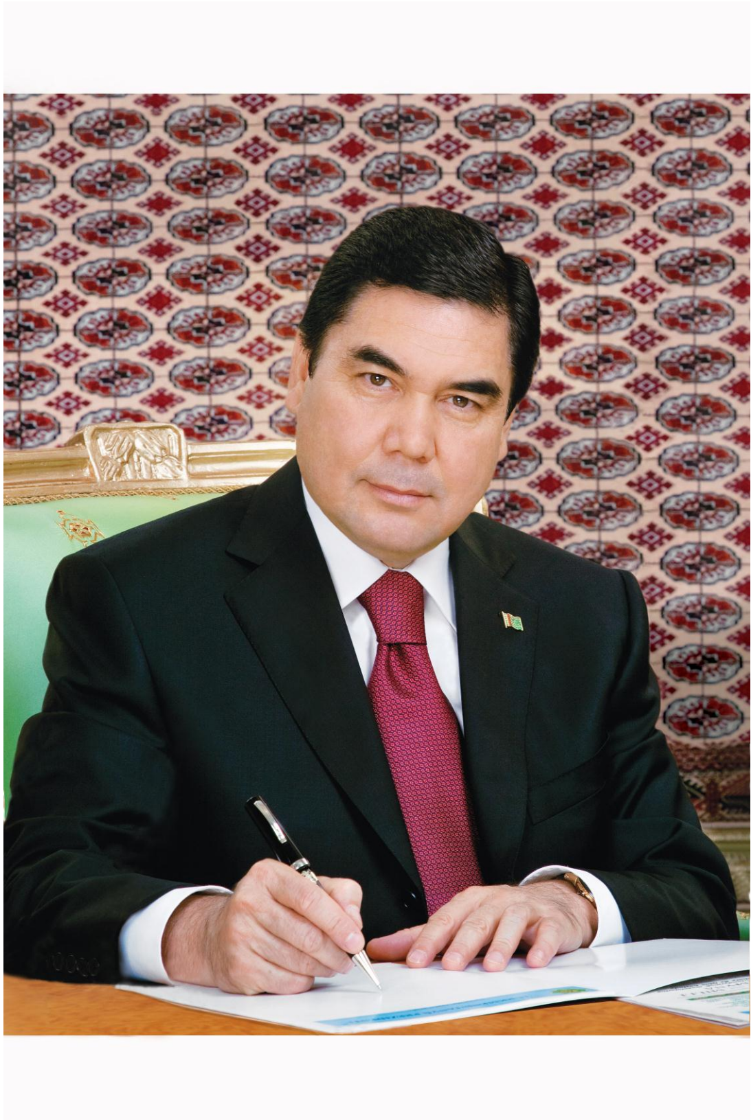
GARAŞSYZ, BAKY BITARAP TÜRKMENISTANYŇ PREZIDENTI GURBANGULY BERDIMUHAMEDOW