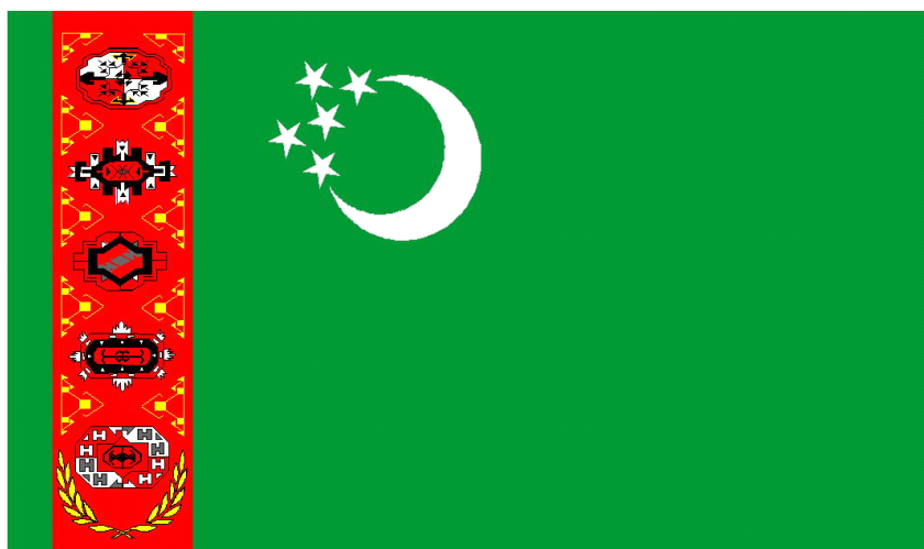
TÜRKMENISTANYŇ DÖWLET BAÝDAGY