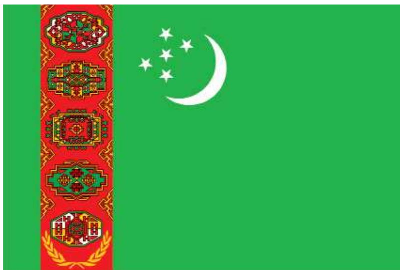
TÜRKMENISTANYŇ DÖWLET BAÝDAGY