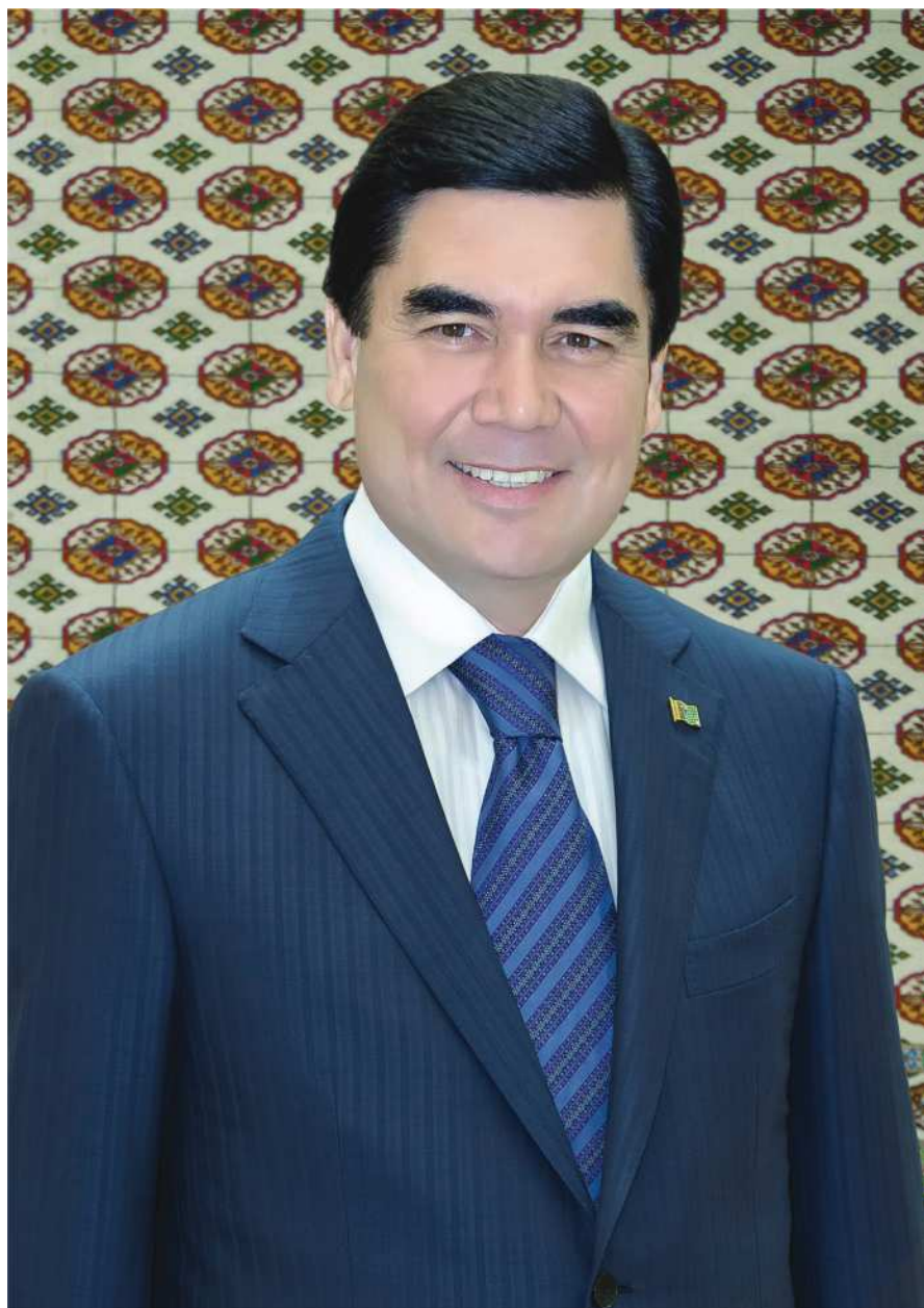
TÜRKMENISTANYŇ PREZIDENTI GURBANGULY BERDIMUHAMEDOW