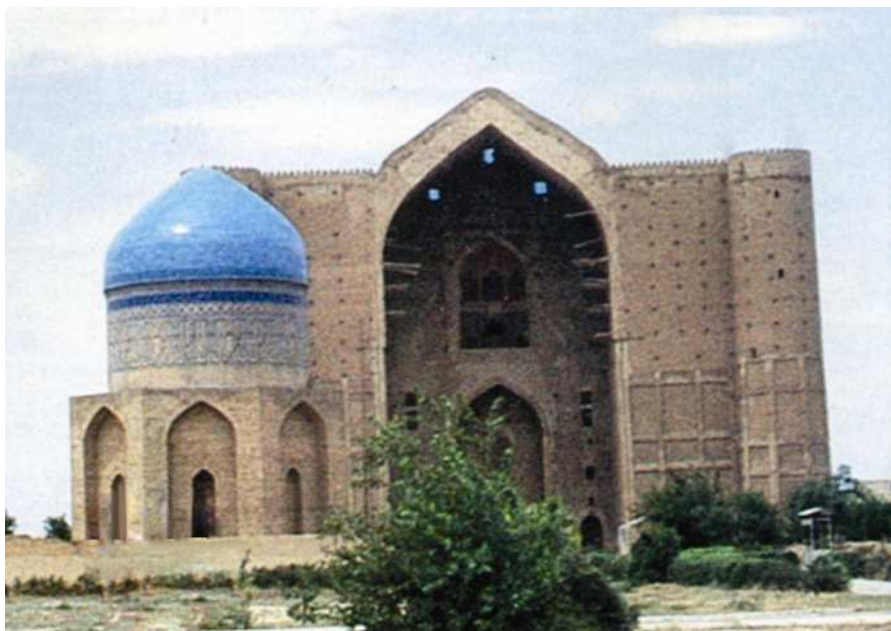
Hoja Ahmet Ýasawynyň hormatyna teýmirleňiň we Abdylla hanyň gurduran türbesi.

Gul Hoja Ahmet göwher ýaňlyg hikmet aýdy, Ezizleriň medhi birle sözün ýaýdy, Uzyn tünni Güne ulap, kyýam durdy, Doga okap, rowan hikmet aýgum geler.