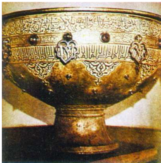
Hoja Ahmet Ýasawynyň türbesindäki XIV asyrdaky ýasalan 40 gulak gazany.

«El est» 1 hamryn piri-mugan doýa berdi, Içiberdim, mukdarymça guýyberdi, Gul Hoja Ahmet, içim-daşym köýüberdi, Talyplara dürri-göwher saçdym, dostlar.