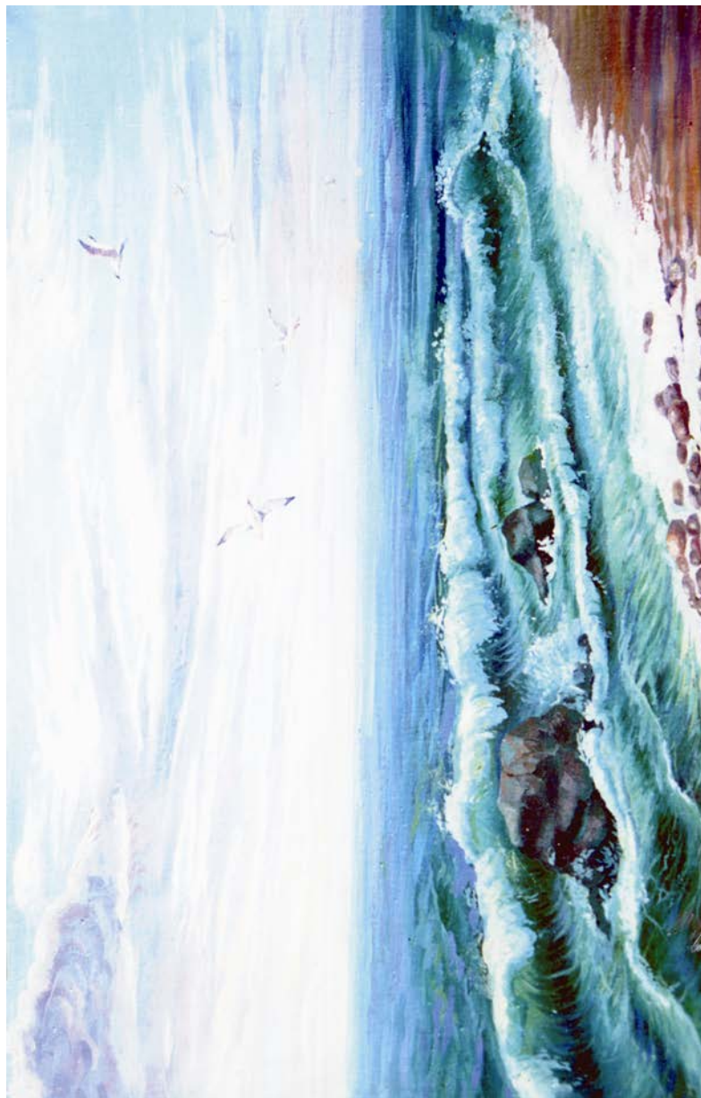
Mawy tolkunly Hazar. Ahat Nuwwajewyň çeken suraty.