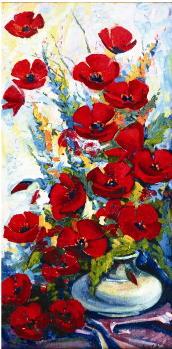
Ahat Nuwwayewyň çeken natýurmorty.