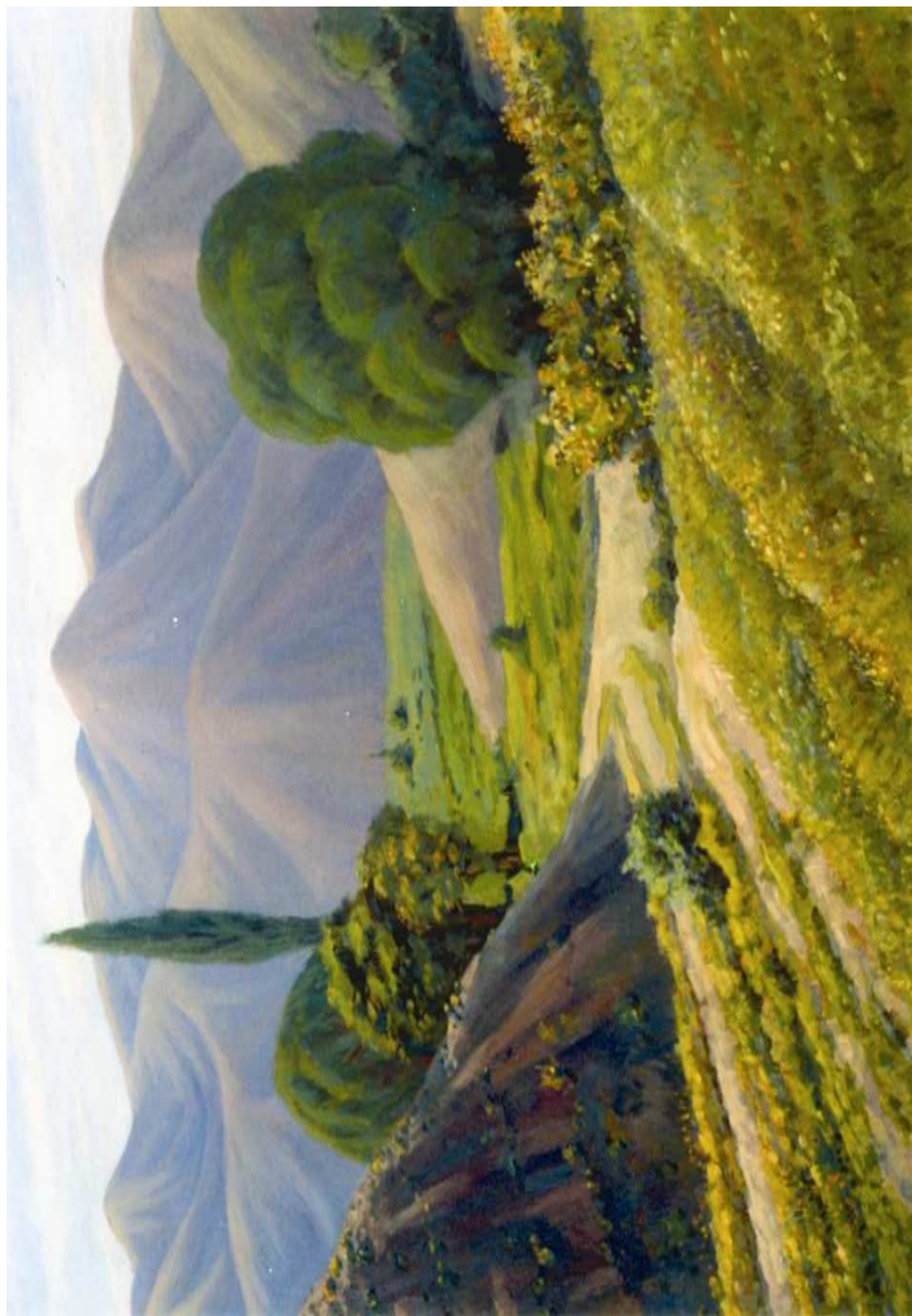
Parhaý. Mäterguly Orazberdiyewyň çeken suraty.