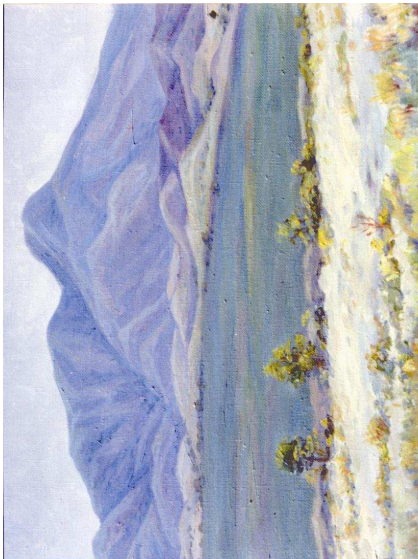
Sunt dagy. Mäterguly Orazberdiyewyň çeken suraty.