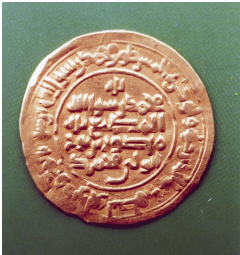
Köneürgenç türkmenleriniň hökümdary Muhammediň döwrüniň altyn dinary.

berýändirler. Şalaryň gyljy uruş üçin syrylandan soňra yzyna-gynyna salynýan däldir. Pylana edýän we etjek işleri üçin minnetdarlygymy bildirýärin.