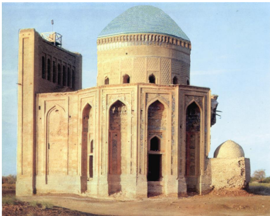
Köneürgenç. Törebeghanym mawzoleýi (XIV asyr).

bu döwletiň we onuň halypasy, möminleriň emiri, musulmanlaryň ymamynyň ömri uzak, işi rowaç bolsun, Allatagala ony öz penasynda aman saklasyn!