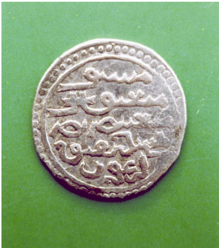
Köneürgenç türkmenleriniň hökümdary Muhammediň döwrüniň mis teňnesi.

teňleşdirmekdir. Bu ýollaryň haýsy birini saýlap almak onuň öz elindedir. Birinji ýoly saýlap alsa dogry ýol bilen gider we biziň sylag-serpaýymyza, towpyga mynasyp bolar hem-de ýagşyzada adamlaryň hataryna goşular. Ikinji ýol ony heläkçilige getirer.