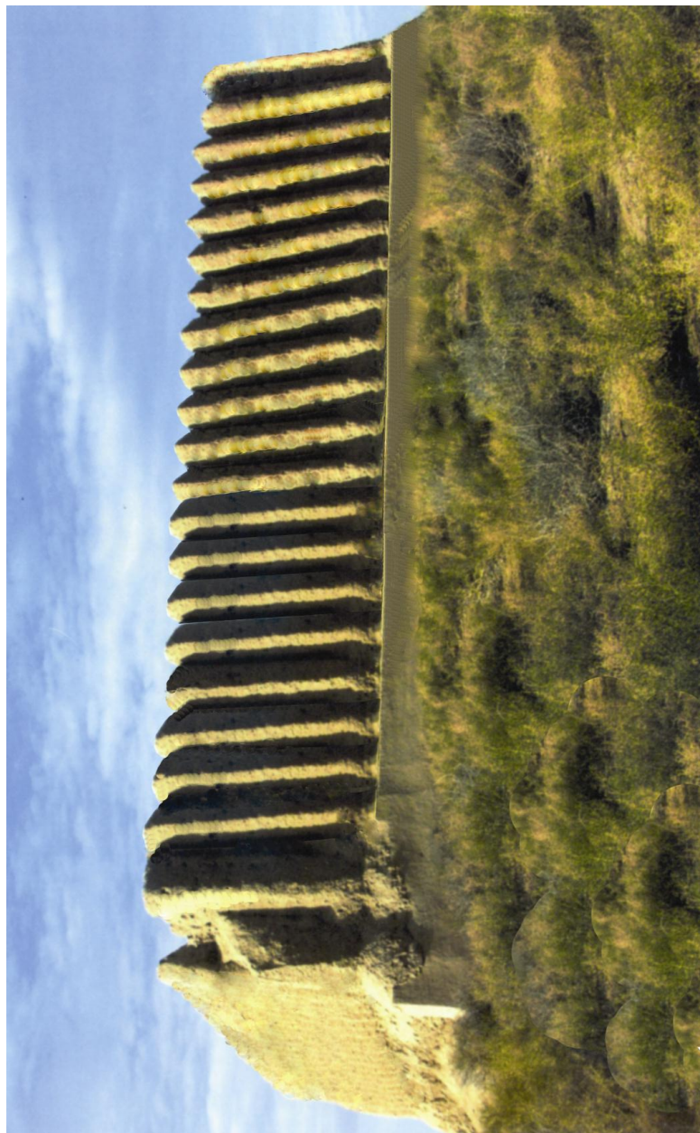
Gadymy Merwdäki Uly Gyzgala.