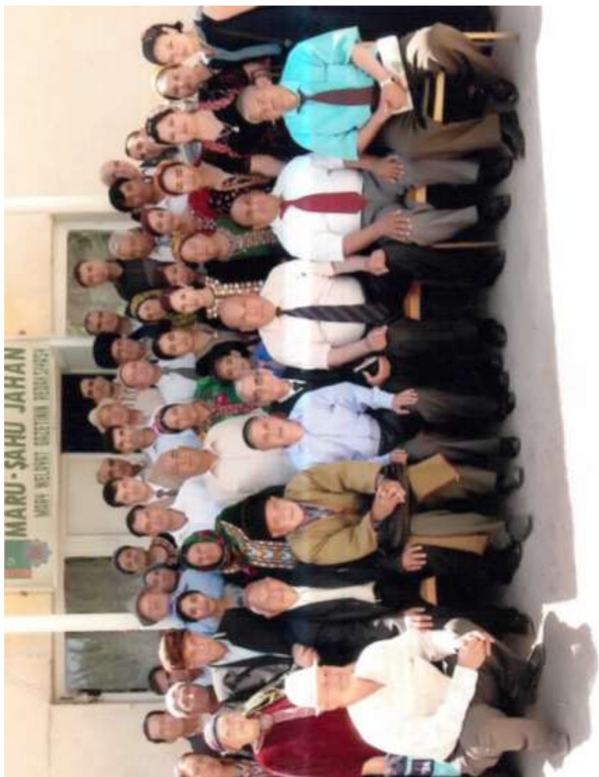
16-нжы Май. 2009-нжы йыл.