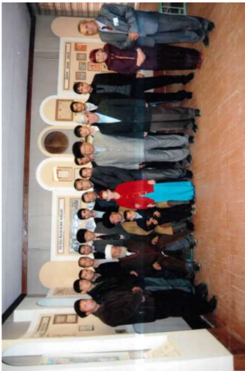
24-нжи октябр. 2010-нжы йыл.