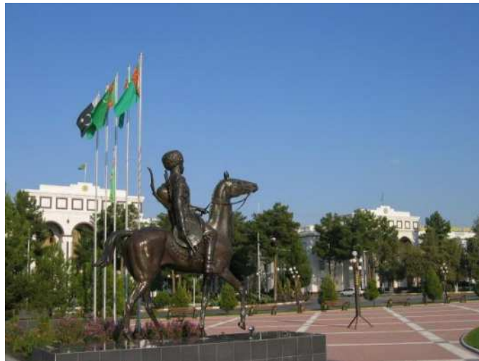
Garaşsyzlykdan soňra ilkinji gezek Türkmenistanda oturdylan Göroglynyň ýadigärligi.