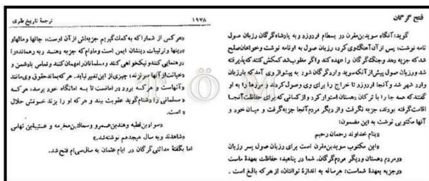
Taryh Tabari. Tom.5. Tahrän 1375 (1996)