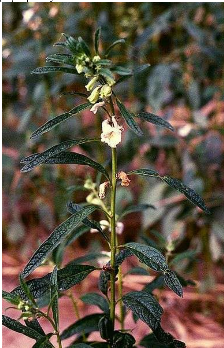
Surat: Künji ösümligi

Emma künji aşgazana zyýanlydyr. Ol tiz doýurýar, işdäni tutýar, ýüregiňi bulaýar hem-de aşgazanyň iýmit bişirişini peseldýär.