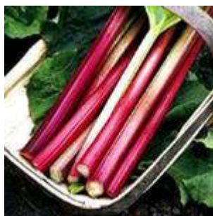
Surat: Yşgyn ýapragynyň baldagy

Yşgyn. Yşgyny sirke garyp çalsaň, ýüzüňdäki menekleri we deriniň tegmillerini aýyrýar. Şu melhem demrewi hem aýyrýar, urgudan ýa-da ýykylmakdan galan agyryny köşedýär. Yşgyn iç süýşende haýyr edýär. Onuň demgysma we gan gusma garşy hem peýdasy degýär.