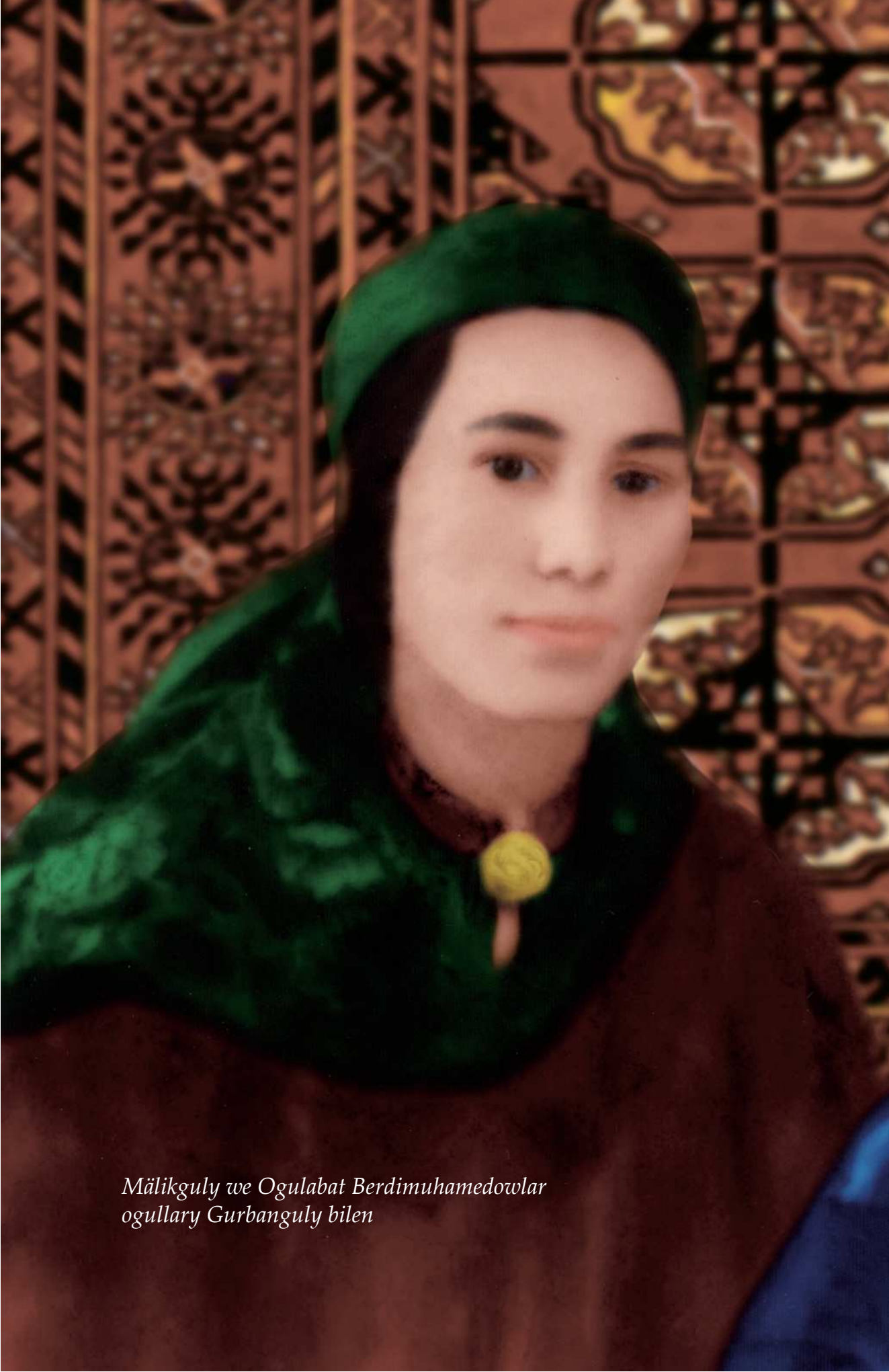
Mälikguly we Ogulabat Berdimuhamedowlar ogullary Gurbanguly bilen