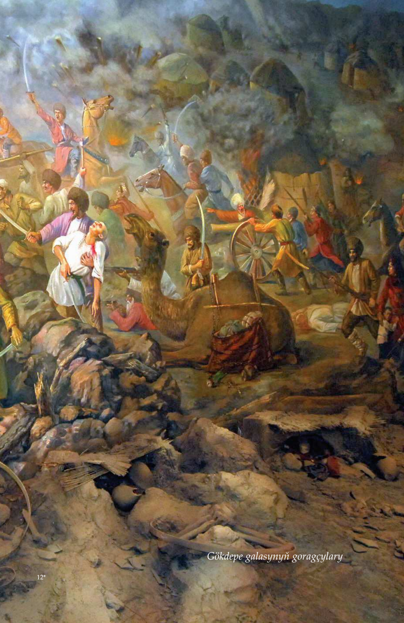
Gökdepe galasynyň goragçylary