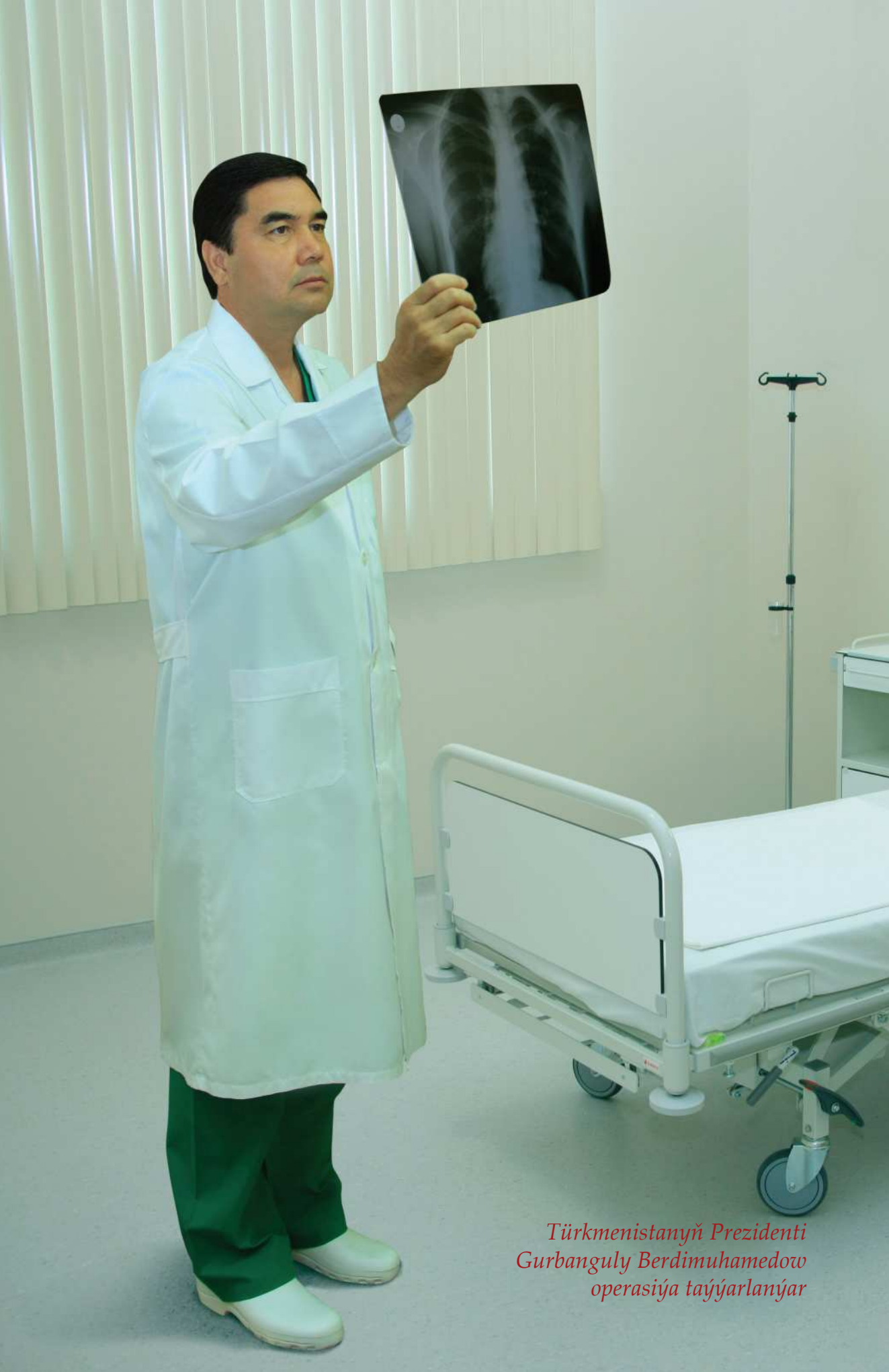
Türkmenistanyň Prezidenti Gurbanguly Berdimuhamedow operasiýa taýýarlanýar