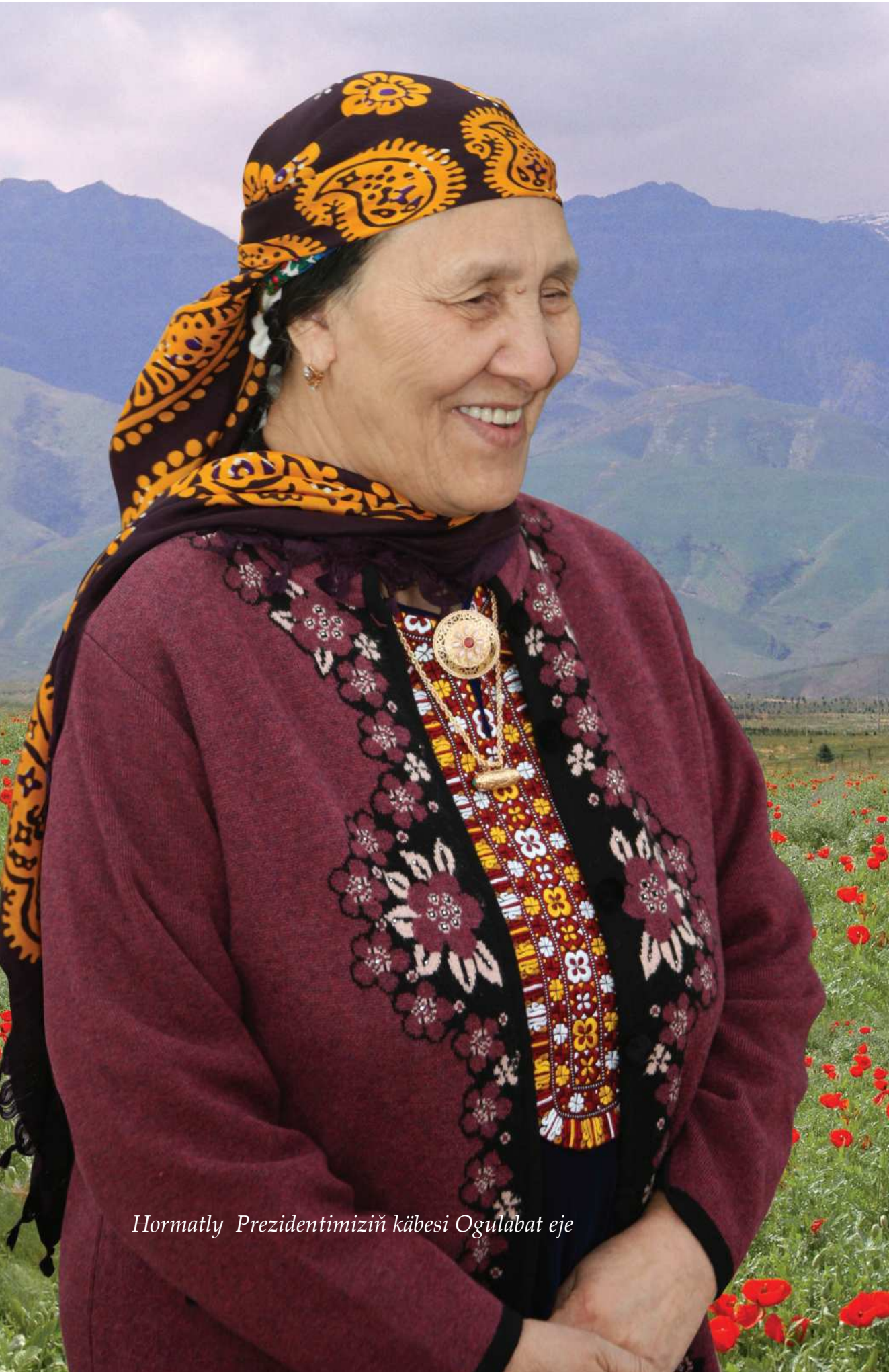
Hormatly Prezidentimiziň käbesi Ogulabat eje