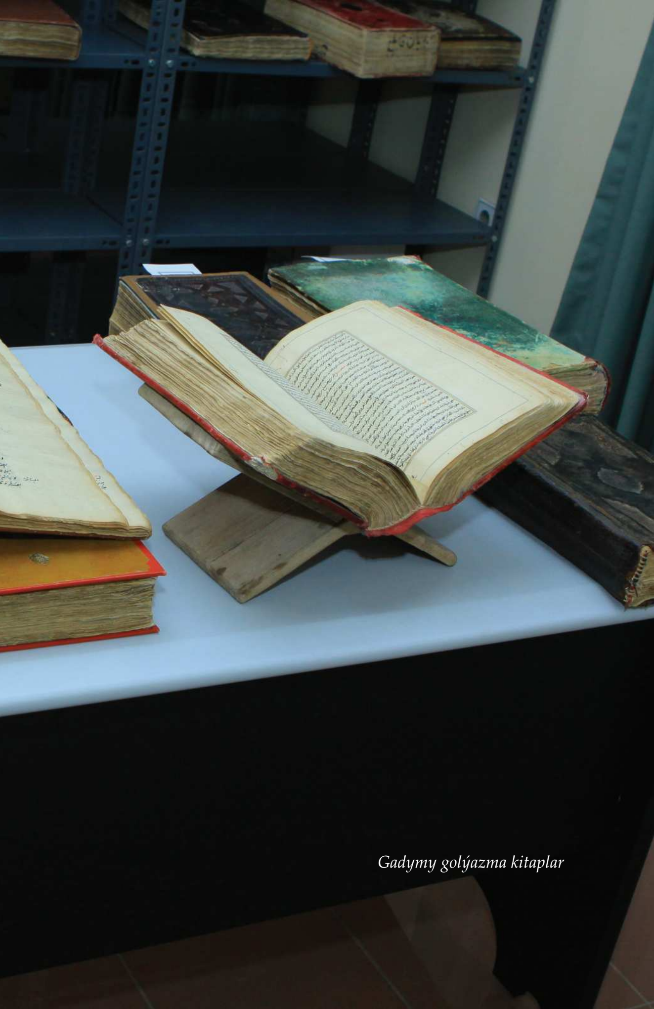
Gadymy golýazma kitaplar