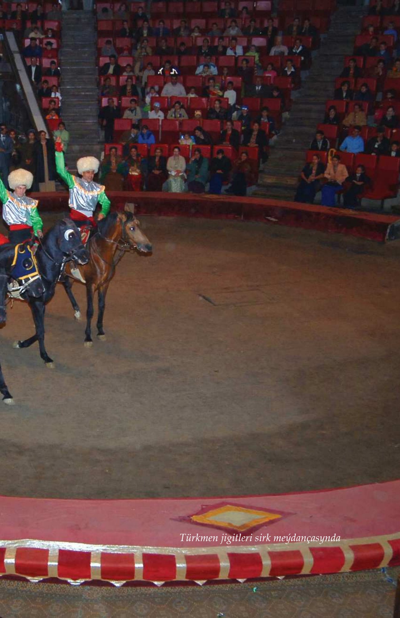
Türkmen jigitleri sirk meýdançasýnda