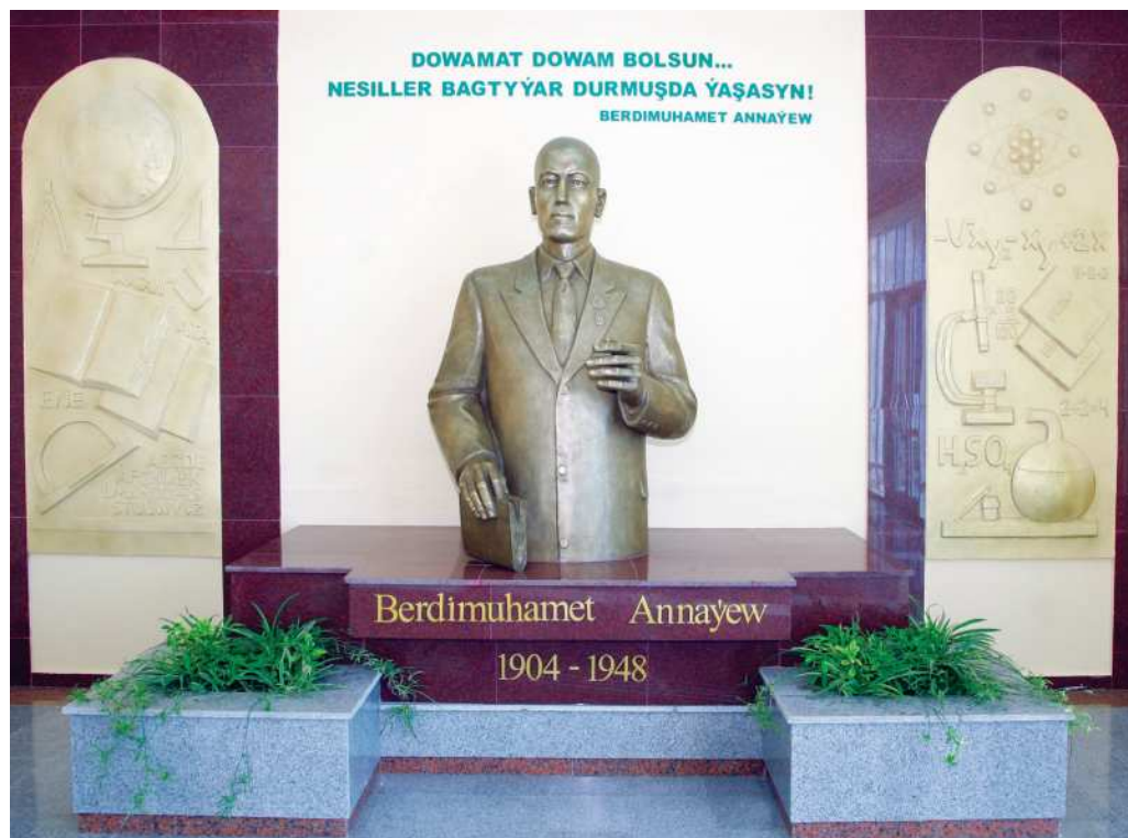
Hormatly Prezidentimiziň atasy Berdimuhamet Annaýew