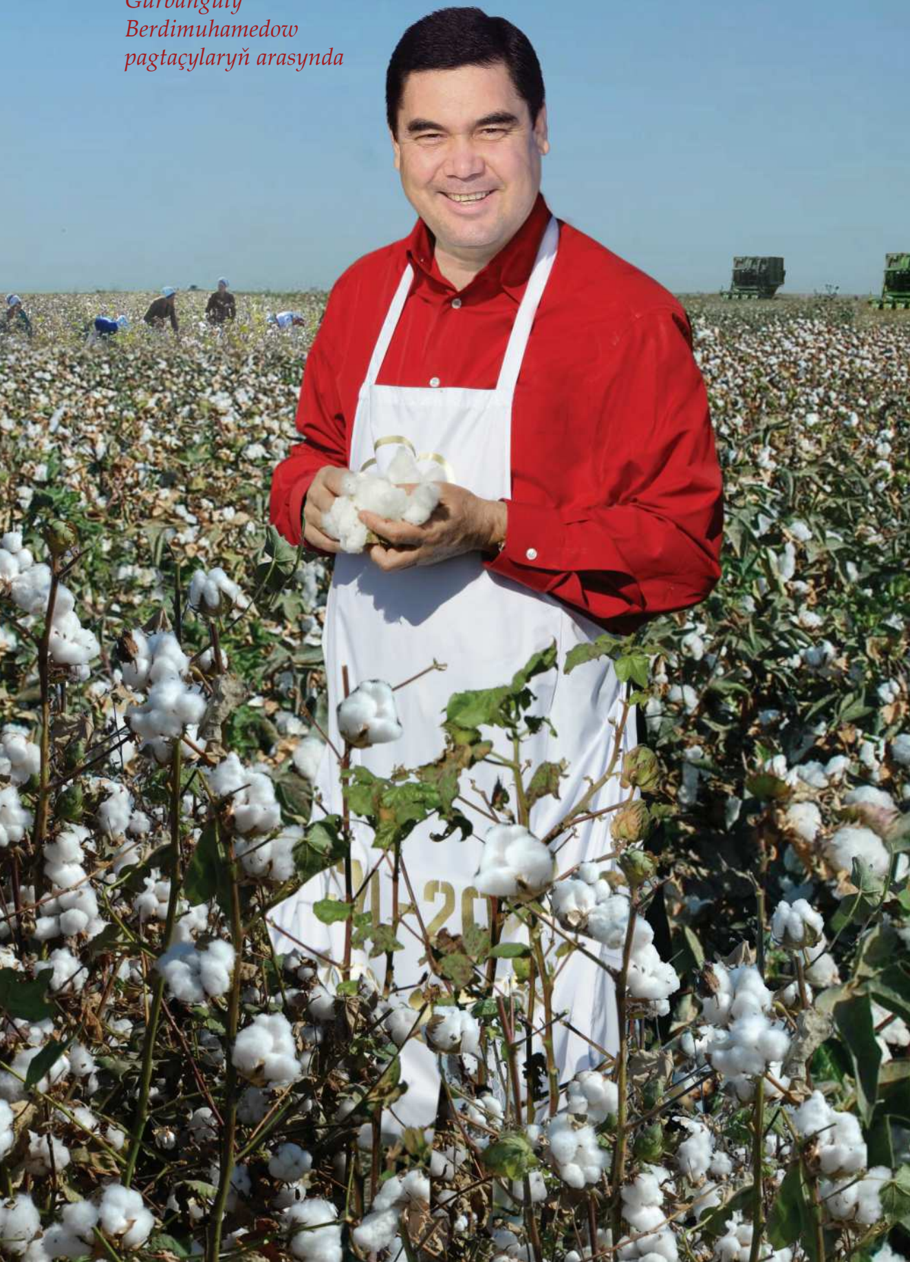
Türkmenistnayň Prezidenti Gurbanguly Berdimuhamedow pagtaçylaryň arasynda