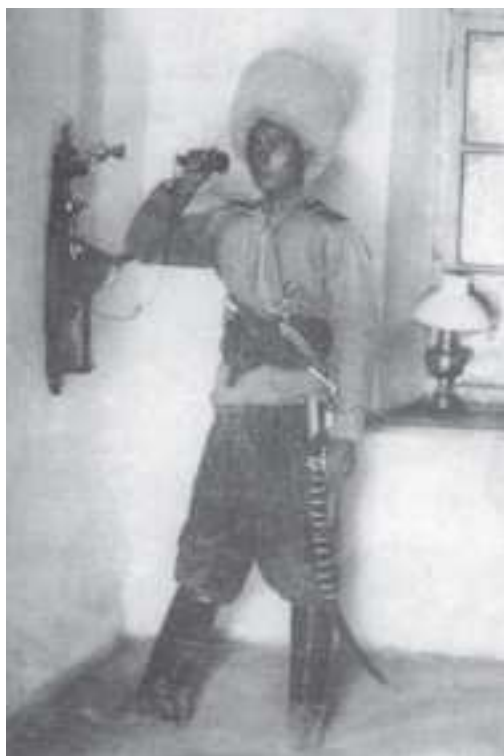
Türkmen atly diwiziýasynyň atlysy. 1914-nji ýyldan öňki surat, Köşi obasy

Türküstanyň general-gubernatorynyň buýrugynda şeýle diýilýär: