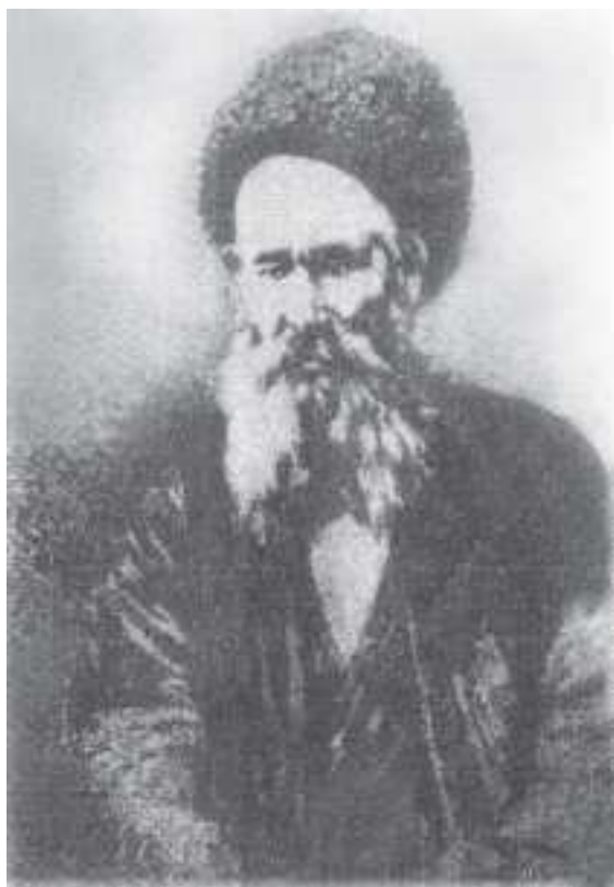
Öwezmyrat Dykma serdar. XIX asyryň ahylary.

Türkmenistanyň çäklerine girmek bilen patyşa generallary türkmenleriň azatlyga çäksiz ymtylyşyny, öz Watanyňa we erkinlige durky bilen berlendigini göz önünde tutmandylar. Milletiň bu esasy sypaty Watan üçin howply pursatda ony jebisleşdirdi.