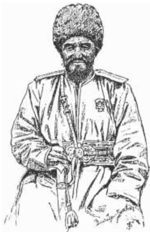
Teke hany. L.Ý.Dmitriýew-Kawkazskiniň eseri, 1894 ý.

boýunça Kawkazda ýola goýlan işler örän oňat netijeler berýär.