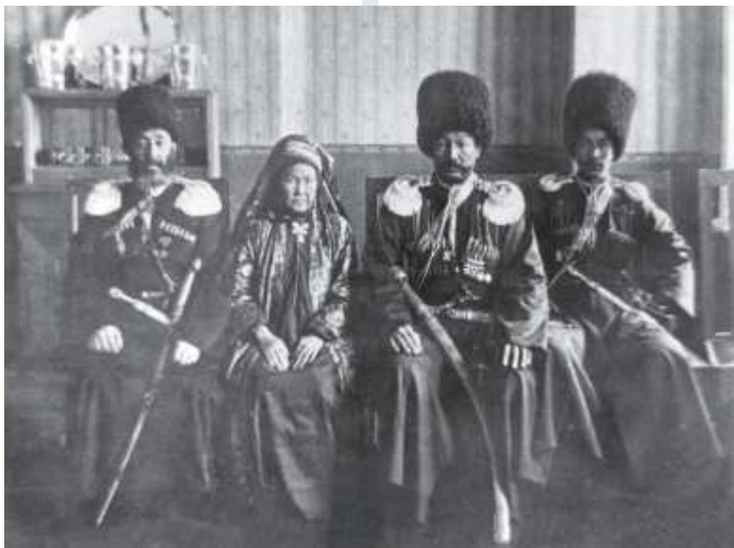
Zakaspi oblastynyň hanlary. Çepden ikinji Merwiň han zenany Güljemal han, XIX asyr.

ýän türkmen ýigitleri harby gullugy dowam etmäge we ş.m. mümkinçilikleri aldylar.