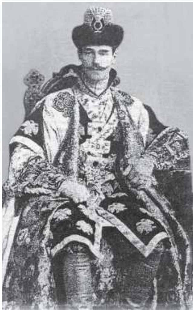
«Wagşy» (Dikiý) diwiziýasynyň serkerdesi, Nikolaý II-niň dogany Beýik knýaz Mihail Aleksandrowiç.

zyzý üzülmän iberilipdir. Munuň özi ýerli halkyň frontda söweşýän öz perzentleri barada aýratyn alada edendiklerini görkezýär. Haýsy goşun bölümi Türkmen polkunyňky ýaly şeýle yhlas hem-de alada bilen gurşaldyka? Eger bu barada jedellesip bolýan