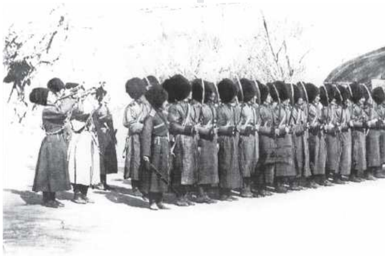
Türkmen atly diwiziýasynyň 3-nji wzwody. XX asyryň birinji onýyllygy.

(Kamens-Podolsk şäheriniň muzeýinde) we harby suratkeş Kowalewskiniň «Polkownik Ýomudskiniň edermenligi» (Sankt-Peterburgyň Ermitažynda) diýen eserinde beýan edilýär. 1878-nji ýylda Watana gaýdyp gelensoň, Ýomudskiý Zakaspi bölümünde (Krasnowodsk, häzirki Türkmenbaşy şäheri) hökümet emeldary wezipesinde işleýär. 1879-