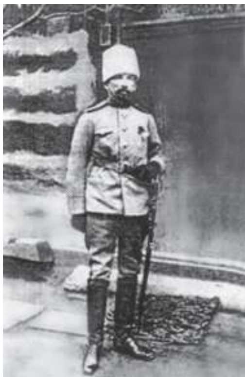
Rus goşunyň belent serkerdebaşysy general L. G. Kornilow (1870–1918).

üçüsi hem türkmen lybasyny geýinipdirler: donly we telpekli, mongol sypat Kornilowy azyýaly hasaplapdyrlar. Ol öz ýany bilen fotoapparat we kiçijik albom alýar. Olar alty hepdeläp owgan obalaryna aýlanypdyrlar. Olary eýýäm ölendir öýdüpdirler. Ine, birdenem garadan gaýtmaz kapitan peýda bolýar, üstesinde berkitmeleriň çyzgysyny we suratlary ýany bilen getirýär 136 .