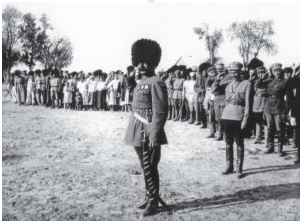
Semyon Mihaýlowiç Budýonnyý, 1925 ý. Poltarask şäheri (Aşgabat).