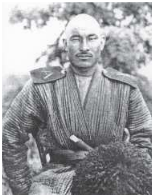
Atly-irregulyar diwiziýanyň mundirindäki türkmen. Sankt-Peterburgdaky Rus etnografiýa muzeýi (№40-107), XIX asyr.