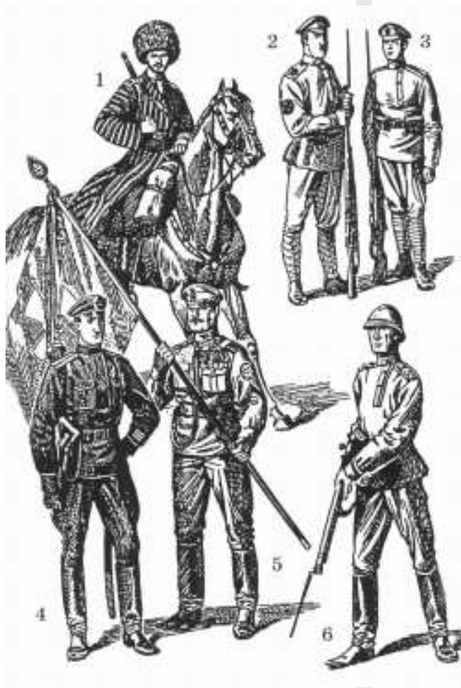
Rus goşunynyň harby bölümleri, 1916 ý. O. Parhaýewiň suraty.