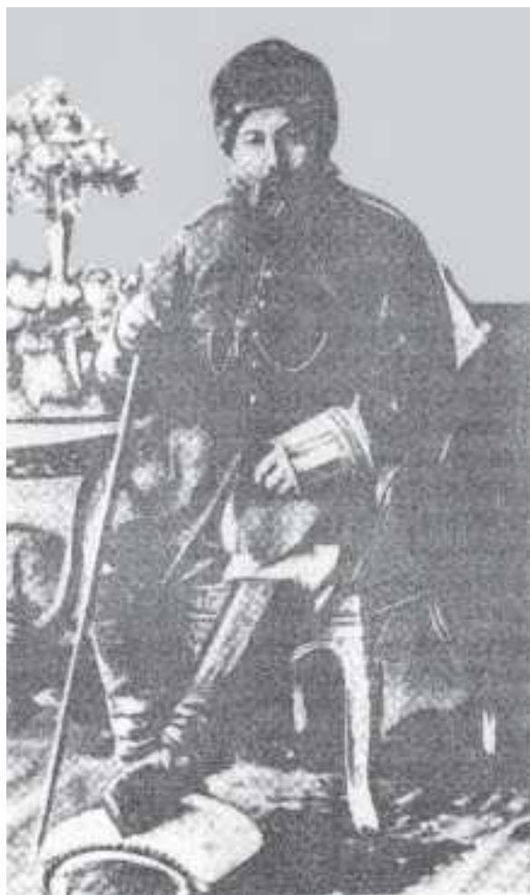
Abdyrahman han — Owganystanyň emiri. XIX asyryň 80-nji ýyllary.

da çykarylan buýruk saklanyp galypdyr. 39