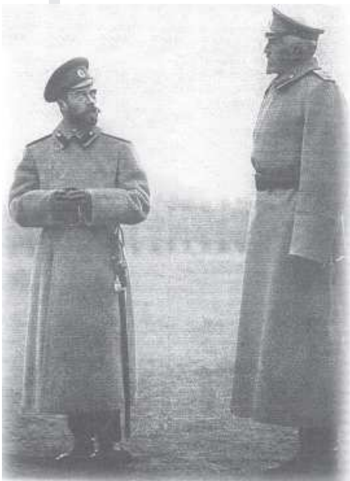
Imperator Nikolaý II we onuň doganoglany Beýik knýaz, goşunlaryň serkerdebaşysy Nikolaý Nikolaýewiç Romanow, 1915-nji ýyl.