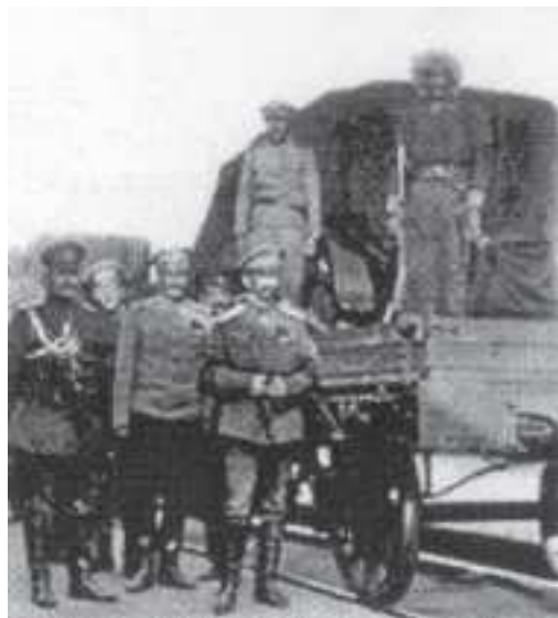
General L.G.Kornilowyň Döwlet maslahatynyň mejlisine gelişi. Açyk otly platformasynda garawul teke jigidi 1917 ý.