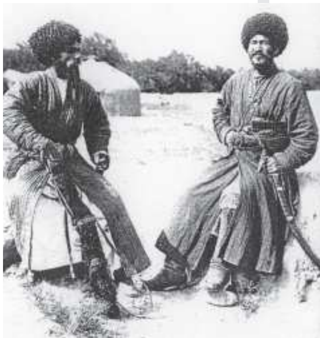
Türkmen milisionerleri. Rus etnografiya muzeýi (№ 1005-3), XIX asyr.

Türkmenler, esasan hem, tekeler öz Watanyňy çäksiz söýýärler. Muny olar Gökdepe urşunda görkezdiler. Şonda ruslar Orta Aziýany basyp alan döwründäki ähli söweşlerini bilelikde alanyňdakydan hem köp ýitgi çekdiler» diýip ýazýar 29 .