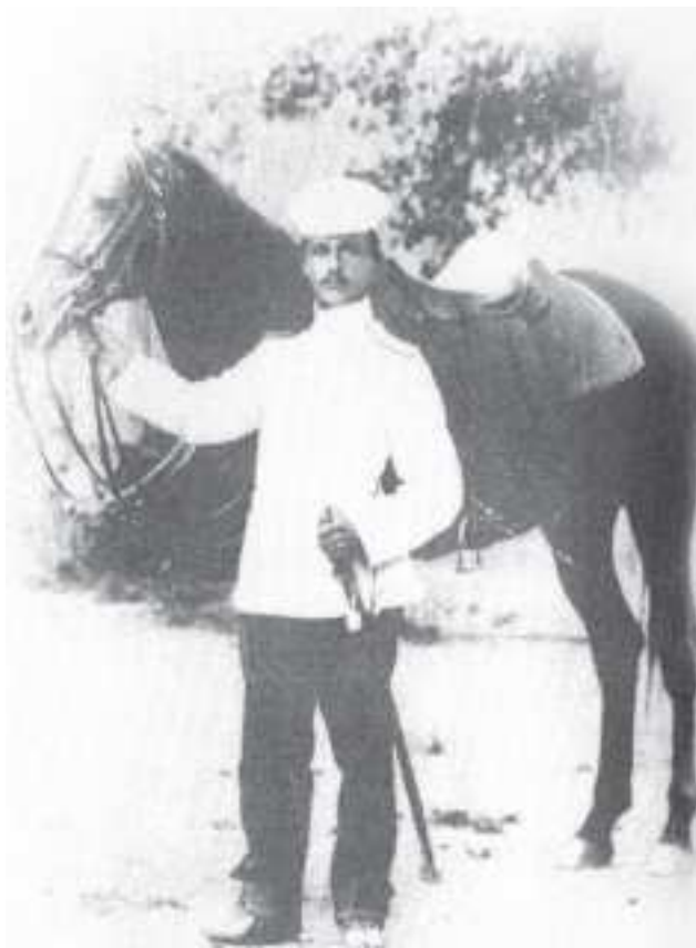
W.Ýançeweskiý. XX asyryň başlary.

larynyň hataryna çyn ýürekden gulluk etmäge barmaklary tötänleýin däldir. Birinjiden, olarda öz-özlerini dolandyrmak hukugy galdyrylypdy; ikinjiden, beýleki goňşy ýurtlar bilen häli-şindi ýüze çykýan çaknyşyklar aradan aýrylypdy; üçünjiden, patyşa hökümeti türkmen ekerançylaryny tohum bilen üpjün edip, goldaw berýärdi; dördünjiden, tutuş ömrüni harby ýörişlerde geçir-