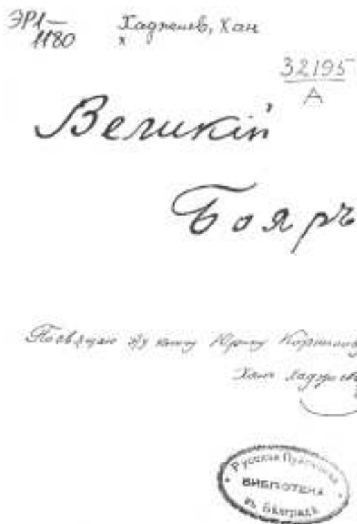
Н.Хажыёўеўі «Белікі Боўар» («Welikiý Boýar») atly kitabynyň daşky sahaby (Belgrad şäheri, M.A.Suworiniň kitap neşirýaty, 1929 ý.)

iki serdary – birinjiden, özüleri ýaly teke adamyny, sada hem ýakyn hemrasyny, ikinjiden, rus serkerdesini – polk komandiriniň kömekçisini, rus serdaryny görýärdiler. Gullukda harby döwrüň ähli hupbatlaryny öz eginlerinde çekip, türkmen esgerleri öz serdarlaryna ýokary derejeli ynsan hökmünde garap, oňa doly ynanýardylar we oňa tabyndylar, şol bir