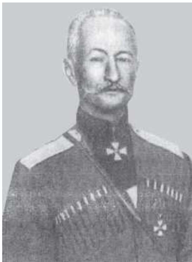
Günorta-Günbatar frontunyň serkerdesi general A. A. Brusilow.

– bularyň hemmesi aljyraňňylyk we goh bilen garyşyp gitdi. Tekeler duşmany tupandan ürken goýun sürüsi ýaly edip kowaladylar we dyr-pytrak etdiler. Bir atly onlarça duşmanyň üstüne eňýärdi we ýeňýärdi.