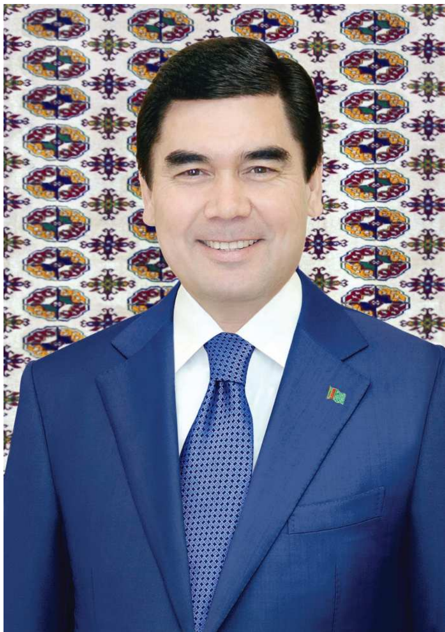
TÜRKMENISTANYŇ PREZIDENTI GURBANGULY BERDIMUHAMEDOW