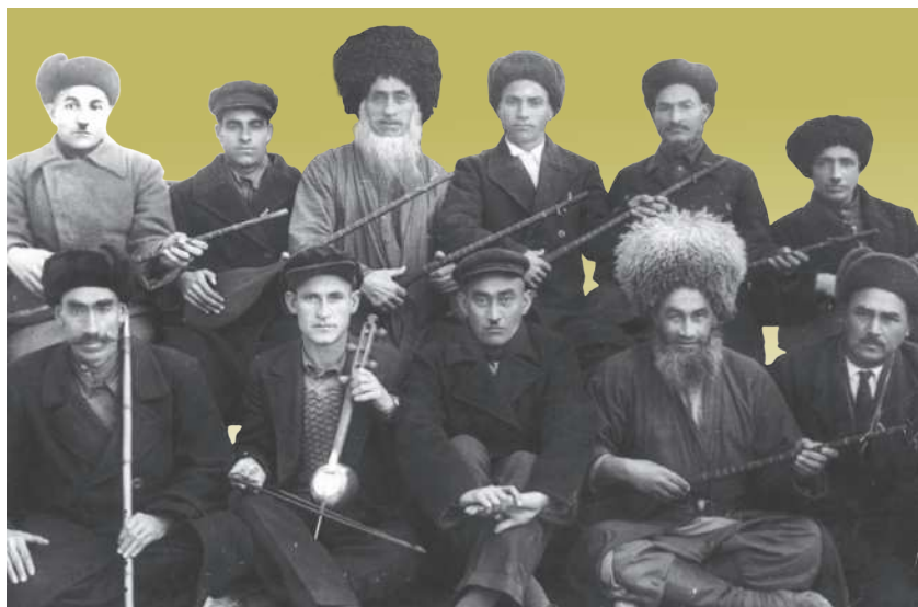
Türkmen radiokomitetiniň bagşy-sazandalarynyň ansambly (1935 ý.)

«Türkmen halk saz gurallarynda ýerine ýetirijiligiň taryhy» atly şu okuw kitabynda milli saz gurallarymyz hakynda gürrüň edilenden soň, gadymyýetden gelýän milli saz sungatymyzyň pajarlap ösmegine egsilmez goşant goşan, şeýle hem biziň günlerimize ýetip gelmeginde öçmejek yz galdyran meşhur halypa dutarçylarymyzyň, gyjakçylarymyzyň, tüýdükçilerimiziň ömri we döredijiligi hakynda giňden söhbet açylýar. Ahal we Mary dutar ýerine ýetirijilik mekdebiniň ussat halypalary we olaryň ýerine ýetirijilik aýratynlyklary barada-da maglumatlar berilýär.