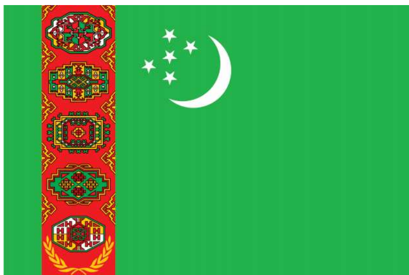
TÜRKMENISTANYŇ DÖWLET BAÝDAGY