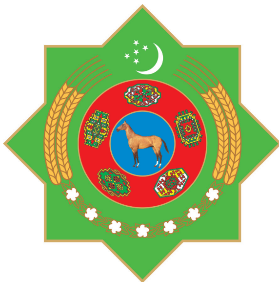
TÜRKMENISTANYŇ DÖWLET TUGRASY