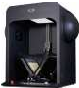
3-nji surat. Nusgalaýjy robot

Döwlet arhiwlerinde elektron-san nusgalary bilen birlikde peýdalanyş gaznasy hem döredilýär.