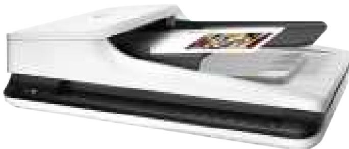
4-nji surat. Nusgalaýjy planşet A4/3 ölçegli

a) nusgalamak we elektron görnüşine geçirmek, surata almak üçin merkezden uzakda (periferiýa) enjam gerek.