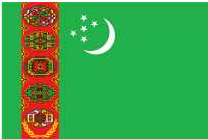
TÜRKMENISTANYŇ DÖWLET BAÝDAGY