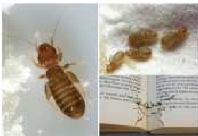
2-nji surat. Arhiw resminamalarynda duş gelýän mör-möjekler

Gadym döwürlerden bäri resminamalar mör-möjeklerden goralydyr. Biziň eýýamymyza çenli papiruslary mör-möjeklerden goramak üçin olara kedr ýagy çalnýpdyr. Şu maksat bilen resminamalaryň sahypalarynyň arasyna ýiti ysly ösümlikleriň ýapraklary ýa-da gülleri salnyp goýlupdyr. Golýazma saklanylýan tekjelere gorçisa, gara burç, zäk sepilipdir. Derili sahaplar bilen iýmitlenýän tomzaklaryň gurçuklary golýazma sahypalaryna geçmez ýaly, onuň jildine gurşun bölegini goýupdyrlar.