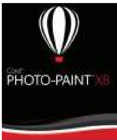
7-nji surat. Corel PHOTO-PAINT (nusgalaýjy planşet A4/A3 ölçegli)