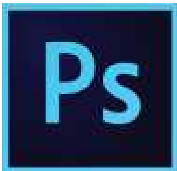
6-njy surat. Adobe Photoshop (nusgalaýjy planşet A4/3 ölçegli)