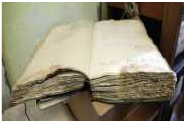
1-nji surat. Kitapda heň kömelekleriniň döremegi

Kömelekleriň ösen ýerlerinde kagyzyň berkligi ýitýär, kitabyň sahypalary gaçýar ( 1-nji surat ). Kömelekleriň käbir görnüşleri kagyzyň ýüzünde sary, mele, gyzy, gara, goňur reňkli pigment tegmilleri galdyrýar. Aýyrmasy örän kyn bolan bu tegmiller kagyzyň görkünü gaçyrýar.