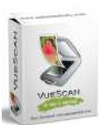
8-nji surat. VueScan (köp hyzmatly enjam üçin)