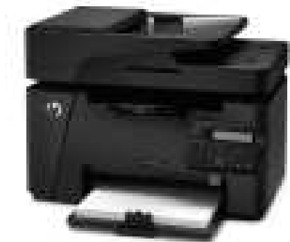
5-nji surat. Köp hyzmatly çap ediji, nusgalaýjy enjam (printer)

b) resminamalary nusgalamak, elektron nusgalaryny işlemek üçin maksatnama üpjünçiligi we enjamlar.