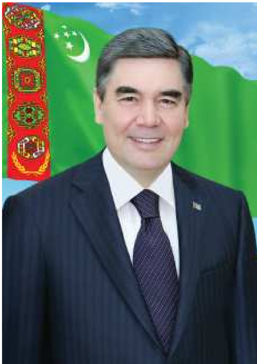
TÜRKMENISTANYŇ PREZIDENTI GURBANGULY BERDIMUHAMEDOW