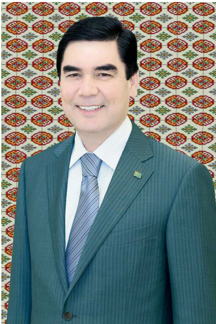
TÜRKMENISTANYŇ PREZIDENTI GURBANGULY BERDIMUHAMEDOW