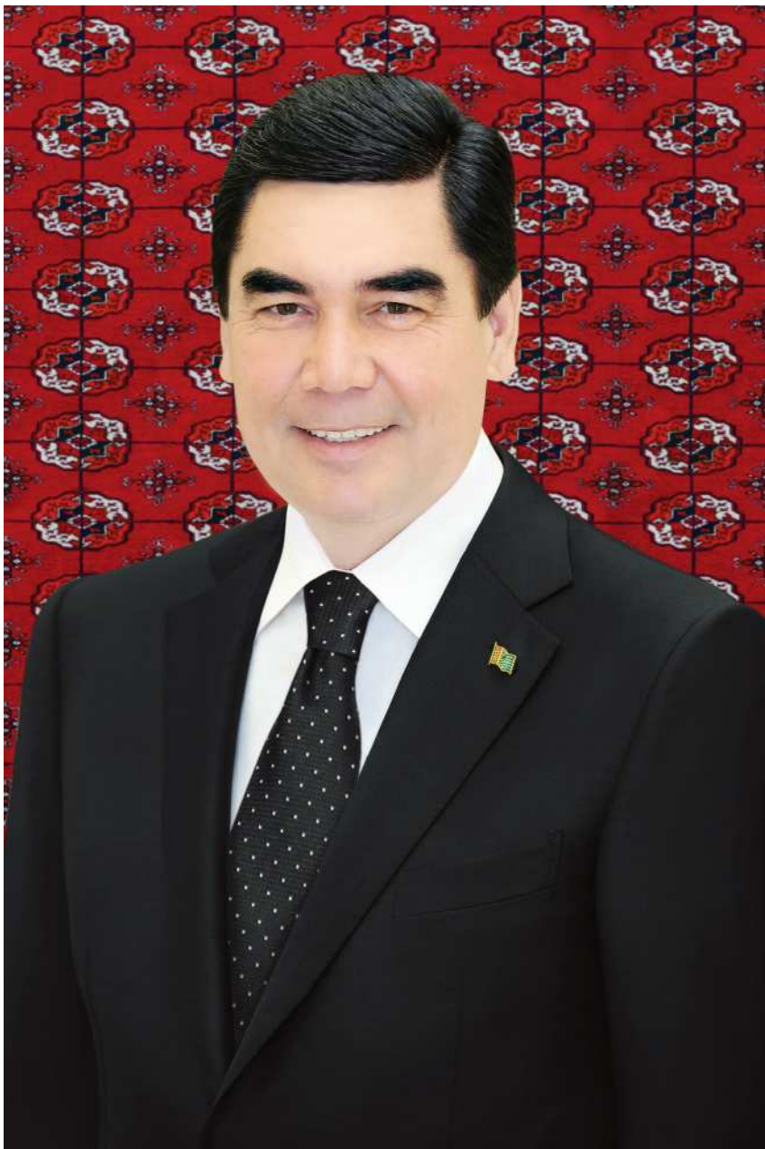
ПРЕЗИДЕНТ ТУРКМЕНИСТАНА ГУРБАНГУЛЫ БЕРДЫМУХАМЕДОВ