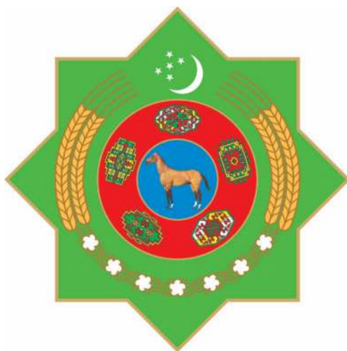
ГОСУДАРСТВЕННЫЙ ГЕРБ ТУРКМЕНИСТАНА