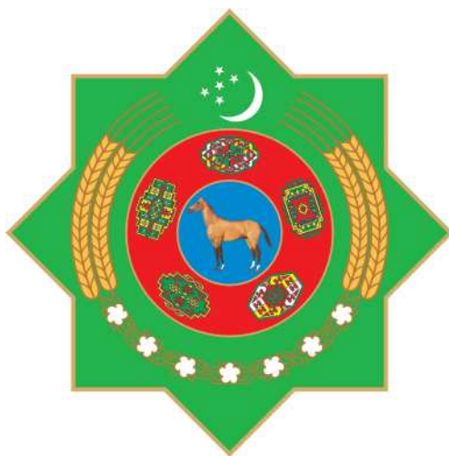
ГОСУДАРСТВЕННЫЙ ГЕРБ ТУРКМЕНИСТАНА