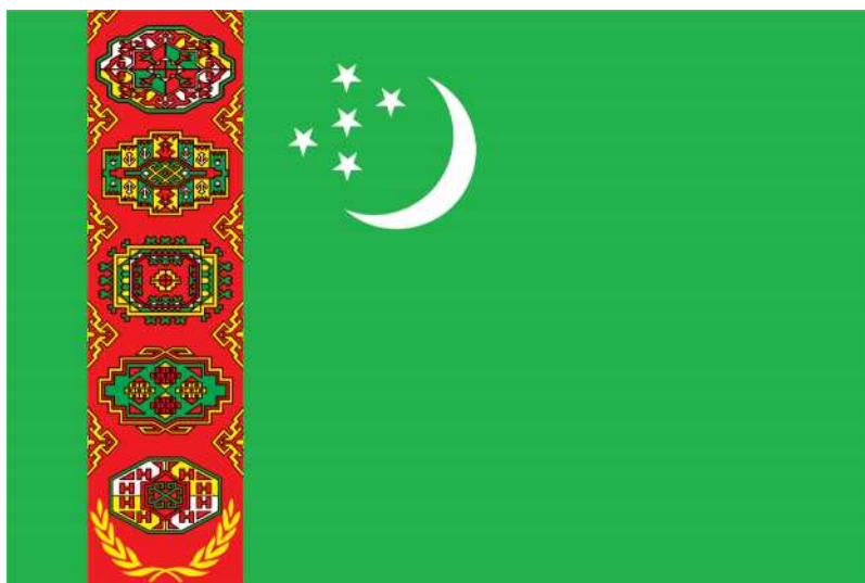
ГОСУДАРСТВЕННЫЙ ФЛАГ ТУРКМЕНИСТАНА