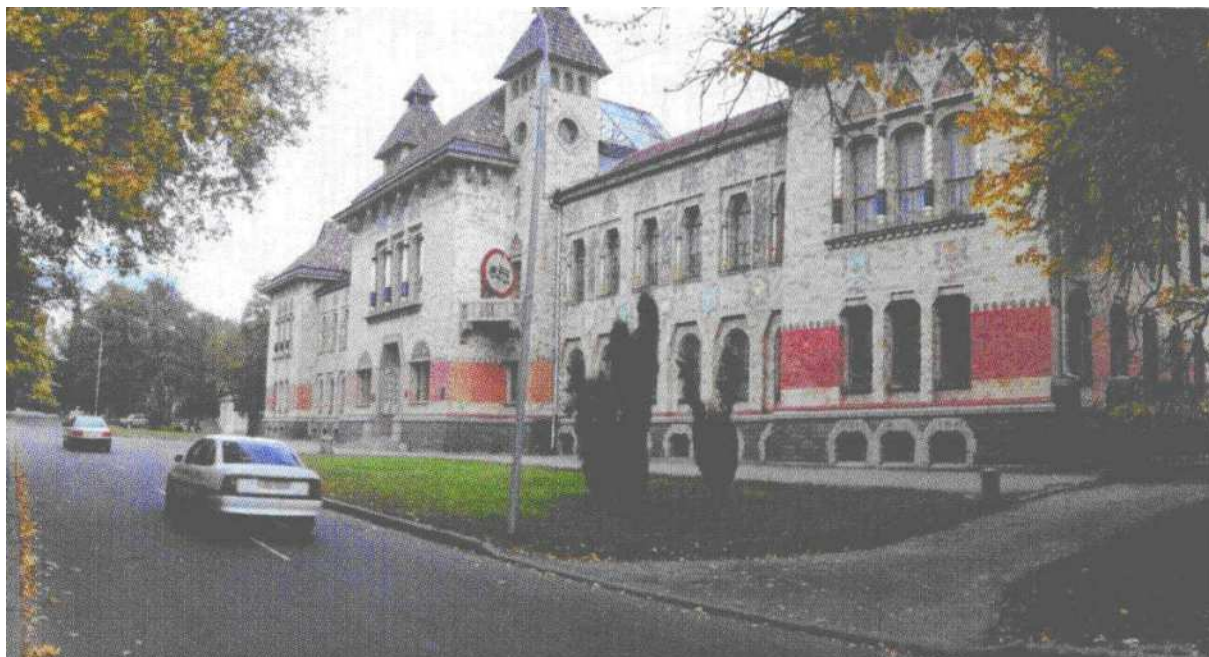
Краєзнавчий музей Краєведческий музей The Museum of Local Lore Taryhy muzeyi