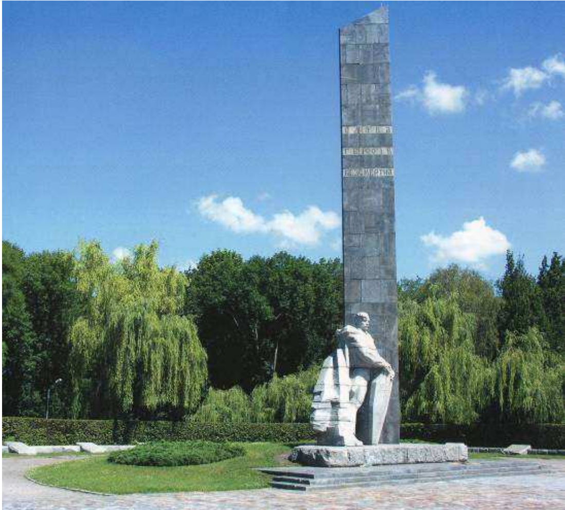
Монумент Солдатської слави Монумент Солдатской славы The Monument of Soldier's Glory Gahryman esgerlerin heykeli