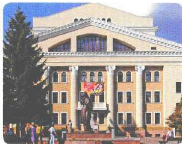
Полтавський обласний музично-драматичний театр ім.М.В.Гоголя Полтавский областной музыкально-драматический театр им.Н.В.Гоголя Poltava velayatynyn Gogol adyndaky aydym-saz drama teatry