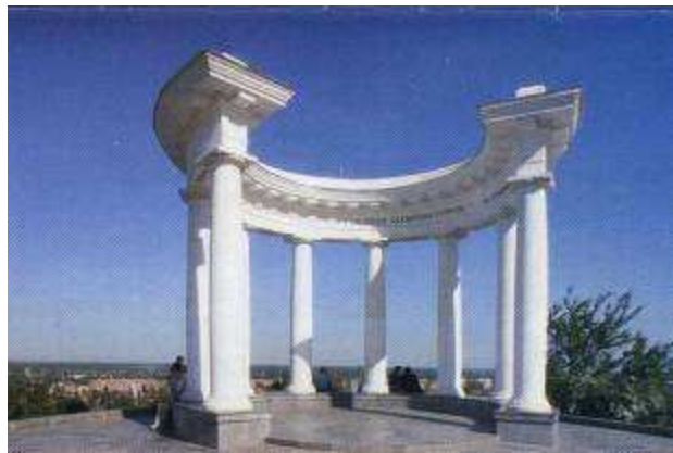
Ротонда Дружби народів Беседка Дружбы народов “Friendship of Nations” Rotunda Gadymy yadygarlik