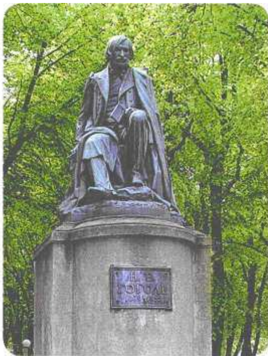
Пам'ятник М.В.Гоголю в м. Полтаві Памятник Н.В.Гоголю в Полтаве The monument to M.V.Gogol in Poltava Gogol adyndaky yadygarlik