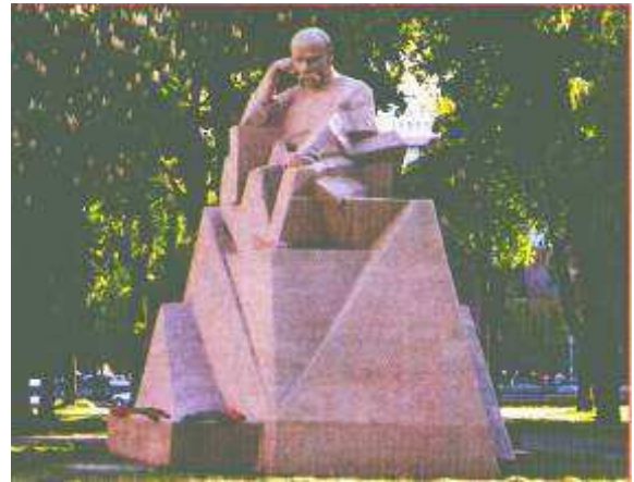
Пам»ятник Т. Шевченку в Полтаві Памятник Т. Шевченку в Полтаве Monument to T. Shevchenko in Poltava Shevcenka adyndaky yadygarlik