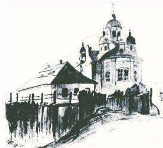
T. Shevchenko`s drawing of I.Kotliarevskyi`s house in Poltava Kotliarevskiy adyndaky seyilgahi