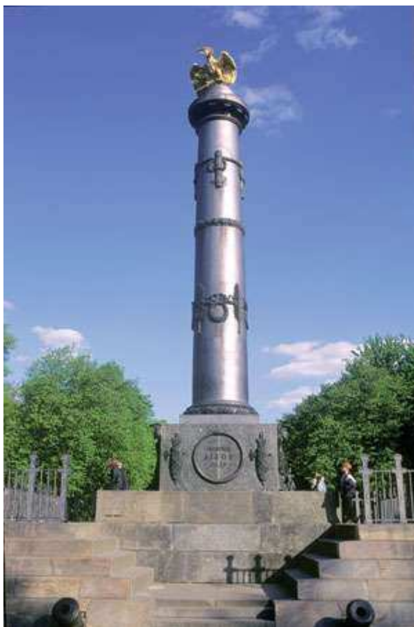
Памятник Славы Пам»ятник Слави Gadumy Yadygarlik