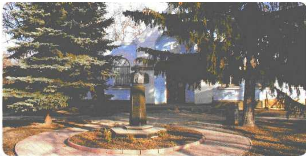
The monument to M.Gogol in front of the Gogol Literary Museum in the village of Velyki Sorochyntsi Gogol adyndaky heykeller