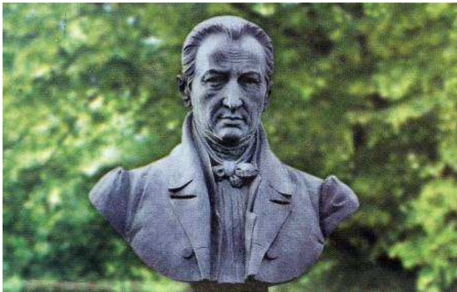
The upper part of the monument to Kotliarevskiy Kotliarevskiy adyndaky heykeller

Будеш, батьку, панувати Поки живуть люди; Поки сонце з неба сяє Тебе не забудуть.