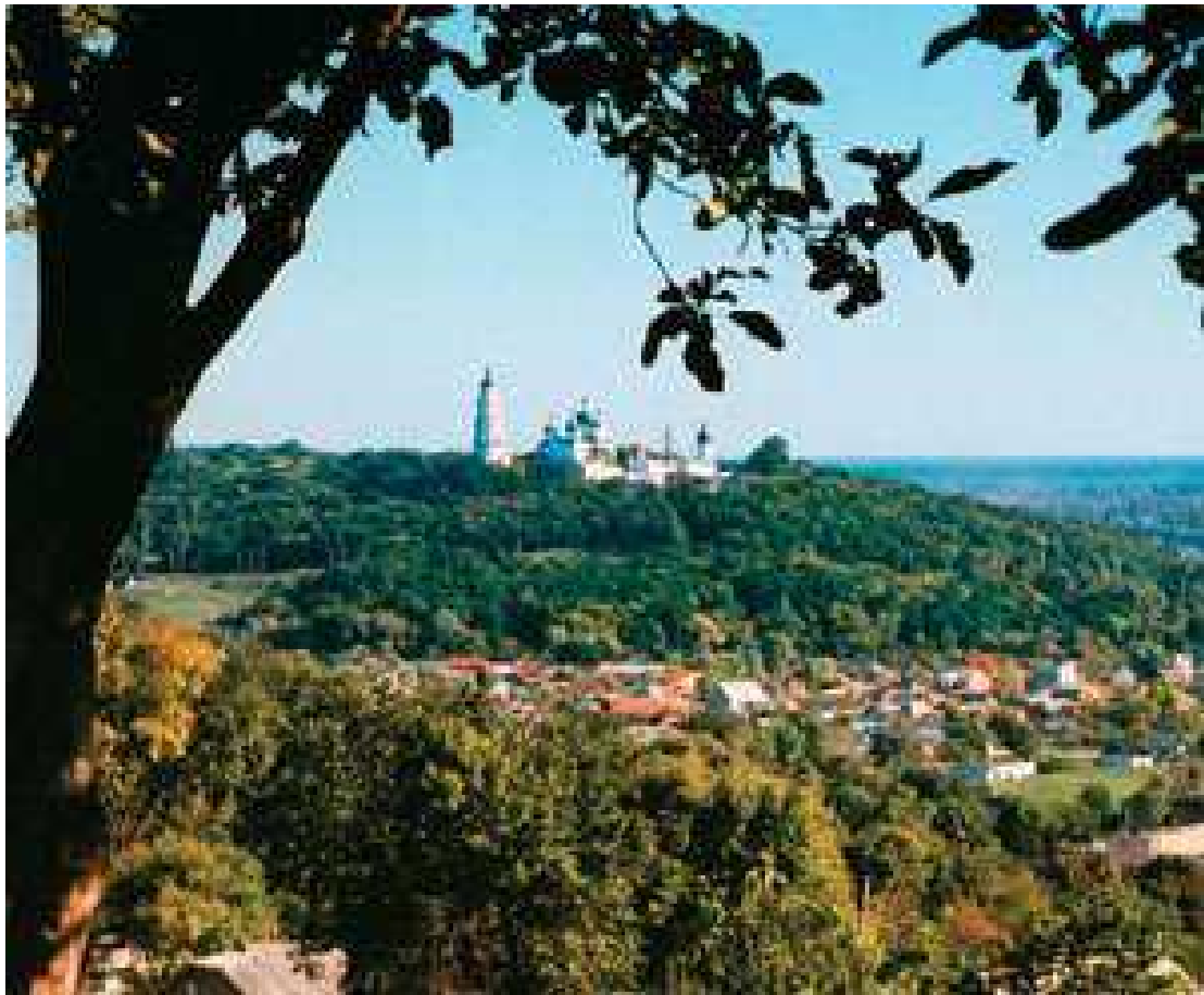
Хрестовоздвиженський монастир Крестовоздвиженский монастырь The Khrestovozdvyzhenskyi Monastery where Charles XII had his headquarters. Kristianlaryn metjidi