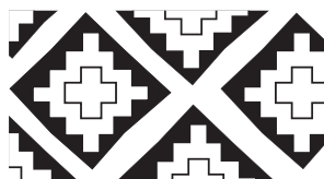
Namazgadepäni II medeni gatlagyna degişli nagşly keramika

Türkmen halylarynyň nagşlary diňe bir b. e. öňki V–IV müňýyllyklaryň küýze önümlerindäki nagşlarda bolman, ondan soňra-ky döwürlerde, has takygy, b.e. öňki II müňýyllyklara degişli diwar bezeglerinde-de bolup, umumylyklaryň bardygy bilen tapawutlanýar.