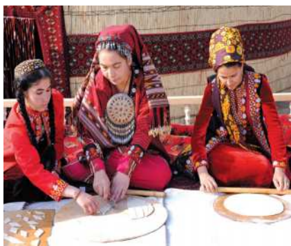
Toý pişmesiniň taýýarlanylyşy

lerde toýuň birinji gününe ýalan çelpek, ikinji gününe çyn çelpek, üçünji gününe toý diýipdirler.