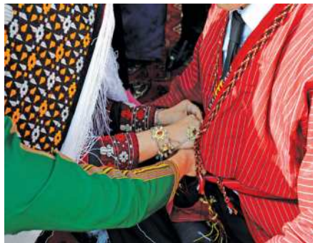
Guşak çözdürmek dessury

Türkmen toýlarynda birnä-çe dāp-dessurlardan soň, agşam, toý şagalaňynyň iň gyzykly ýeri guşak çözdürmek dessury ýeri-ne ýetirilýär. Bu dessura ýaş og-lan-gyzlar we oglanyň ýeňnesi gatnaşypdyr. Gelin ýigidiň ilki guşagyny çözmeli, soň ädigini çykarmaly, soň donuny we tel-peginini çykarmaly bolupdyr. Ýi-gidiň dostlary toýa şowhun ber-mek üçin oglanyň guşagyny örän çylşyrymly daňypdyrlar. Gelin guşagy çözüp oturan wagty oganlar dürli ýollar bilen oňa päsgel beripdirler. Bu ýagdaýda ýigidiň ýeňnesi gelne kömekleşipdir.