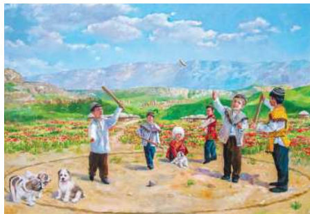
« Çilik » oýny

Bu oýny 4 adamdan 20 adama çenli oýunçylar 2 topara bölünip oýnaýarlar. Iň gownejaý san – ol hem her toparda 5–6 oýunçydan ybarat iki topardyr. Eşekçi oğlan ýa-da eşekçi topar bize, sana-