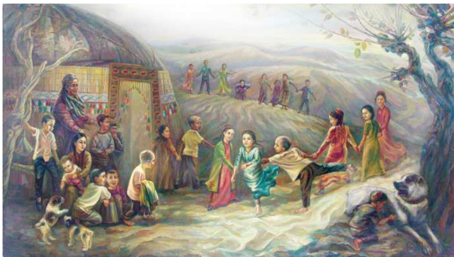
« Aýterek-Günterek » oýny

Oýnuň oýnalyşy. Oýny başlaýan birinji toparyň oýunçylarynyň biri «Aýterek» diýip gygyrýar. Ikinji toparyň oýunçylarynyň biri bolsa «Günterek» diýip jogap berýär. Soň oýun şeýle dowam etdirilýär. Birinji topar «Bizden size kim gerek?» diýip gygyrýar. Ikinji topar «Saýrap duran dil gerek!» diýip jogap berýär. Birinji topar «Dilleriň haýsy gerek?» diýýär. Ikinji topar haýsy hem bolsa garşydaş toparyň biriniň adyny tutup, mysal üçin, «Arslan gerek» diýip jogap berýär. Arslan diýlip ady tutulan oýunçy bat bilen ylgap gelip, ikinji toparyň oýunçylarynyň elleriniň arasyny üzüp, üzen oýunçylarynyň birini öz toparyna alyp gaýdýar. Birinji topar ýene-de hüjümi dowam etdirýär. Eger Arslan garşydaş toparyň arasyny üzüp bilmeýse, onda ol oýny şol toparyň hatarynda dowam etdirýär. Hüjüm etmek gezegi hem ikinji topara geçýär. Oýun gutaranda, haýsy toparda az oýunçy galsa, şol toparyň utuldygy bolýar.