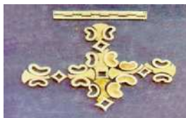
Marguşdan tapylan mozaika

Biziň eýýamymyzdan öňki II müňýyllyga degişli Goňur gonamçylygynda geçirilen arheologik barlaglaryň netijesinde guburhanalardan tapylan mozaikalaryň ýüzünde gipsden we daşdan şekillendirilen nagşlarda hajyň alamatyny aňladýan görnüşlere gabat gelmek bolýar. Bu nagşyň üç burçy meňzeş görnüşde, bir burçy bolsa romb görnüşinde şekillendirilipdir. Haç nagşy birnäçe şekiljikleriň üsti bilen birleşdirilmegi netijesinde ýerine ýetirilipdir we nagşlaryň kompozisiýasyny emele getiripdir. Şeýle haç görnüşli nagşlar türkmen halylarynda-da özüniň mynasyp ornuny tapýar. Mysal üçin, «guşly göl» nagşly türkmen halysynyň merkezinde gölleriň setiralarynda ýerleşdirilen «çemçegölçe» ýa-da «gurbaga» nagşlar bilen mozaikanyň meňzeşligini görmek bolýar. Bu nagş halyda-da edil mozaikada şekillendirilen hajyň alamaty ýaly birnäçe nagşlaryň birleşmeginde emele gelýär.