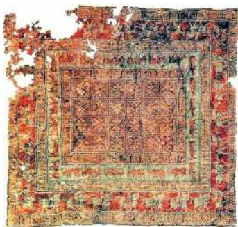
B. e. öňki V asyra degişli Pazyryk halysy

Häzirki wagtda hem özüniň meşhurlygy bilen dünýä tanalýan türkmen halylaryny dokaaýan çeper elli zenanlarymyz şonuň ýaly demirden ýasalan keserleri ulanýarlar. Şol tapylan tapyndylar barlananda, olaryň materiallarynda tapawut bar diýäýmeseň, bitewüligine häzirki keserlere laýyk gelýändigini görmek bolýar. Tapylan tapyndylaryň bir ujundaky deşiğiň tutawaja berkidilendigi, onuň arka ýüzüniň ýiteldilip, bitewi görnüşe eýe bolandygyny görkezýär. Şeýle ýagdaý-