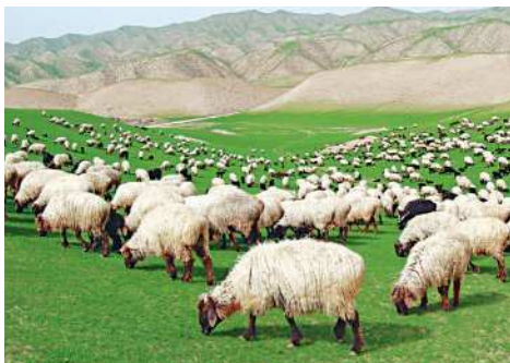
Saryja tohumly goýunlary

usuly ulanylypdyr. Bu bolsa mallaryň gowy taplanmagyna getiripdir. Şol döwürde çopanlar tarapyndan ot-ıým taýýarlamak işi hem geçirilipdir. Her bir süriniň ýanynda çopan we çoluk bolupdyr. Çoluk, esasan, kömekçi hojalyk işlerini ýerine ýetiripdir. Çopan bolsa hemişe süriniň ýanynda bolupdyr.