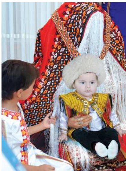
Gelniň gugajyna bäbek berlişi

ýumşak düşekçäniň üstünde otursa, onda ol gelniň ýaltadygy, eger-de oturmasa, ol gelniň işjeňnirligi kesgitlenipdir. Şeýlelikde, gelin öz ornuna geçip oturanyndan soň, onuň çagasynyň köp bolmagyny arzuw edip, gugajyna oglan bäbek, gyz bäbek beripdirler. Şeýlelikde, gelniň getirilmegi bilen baglanyşykly döp-dessurlaryň toplumy tamamlanýar.