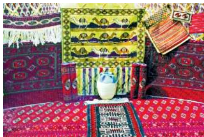
Ak öýüň töri

Erkek adamlaryň oturýan tarapynda (çepde) tagta sekijigiň üstünde däneli argyş çuwaly düýäniň howudy, atyň eýeri, ýüp, don, aýakgap ýaly hojalykda ulanylýan