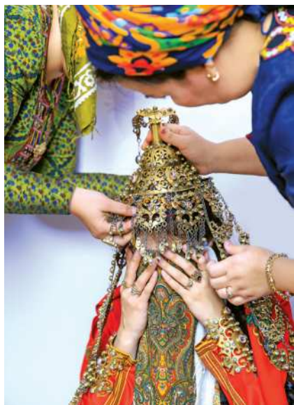
Gyzy geýindirmek dessury

Gyzy geýindirmek dessury. Gyzyň toý egin-eşiklerini gyzyň ýeňňesi geýindirýär. Gyzyň başyna atylýan kürte gaýyn tarapyndan getirilipdir. Günbatar sebitlerde gyzyň başyna çäşew atylýar. Gyzyň toý eşiği – keteni köýnek, çapraz-çaňňaly çabyt, çekelikli gupba, üstünden ak ýaglyk daňylýar (Şol ak ýaglygy toý gününüň ertesi, gelne baş salnanda göreşip, gelni alan aýala beripdirler).