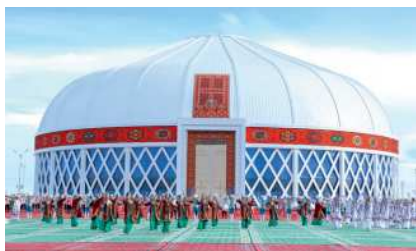
Türkmen ak öýi

şekiller, diwarda gap-gaçlary we beýleki öý goşlaryny goýmak üçin örülen tekjeler bolupdyr.