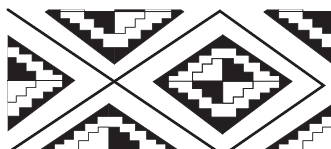
b.e.öňki IV müňýyllygyň ahyryna degişli nagyşly keramika

Hormatly Prezidentimiz «Janly rowaýat» atly kitabynda: «...türk-men halyalarynyň merkezi böleginde, adatça, romb görnüşli dörtburç göller bardyr we olar ekin meýdanlaryny – ýeriň bereketini, zähmet-söýerligi we galkynyşy alamatlandyrýar. Ýöne munuň başga hili dü-şündirilişi-de bar, ýagny bu romb – ähli zady görýän göz. Gözde bolsa jadyly gorajy güýç bar. Tumar – romb dünýäniň dört tarapyňy özün-de jemläp, öýi we onuň eýelerini her dürli bela-beterlerden gorap durýarmyş» diýip belläp geçýär.