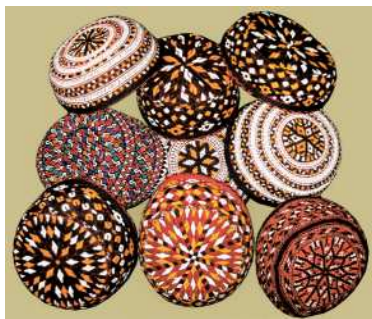
Türkmen tahýasynyň görnüşleri

miziň bagtyýarlyk zamanasynda ol nagyşlar has-da kämilleşip, olaryň sanlary köpeldilip, hatda görnüşlerine-de üýtgeşmeler girizildi.