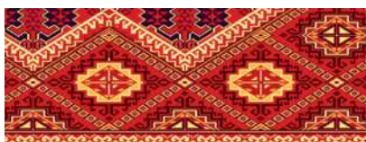
«Balykgaryn» halysynyň gyra nagşy

asman jisimleriniň şekilleri berlipdir. Diýmek, türkmen halylarynda türkmeniň gözeli tebigatyny, ýaşayyş-durmuşyny owadan şekilleriň üsti bilen görmek bolýar.