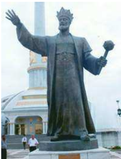
Togrul begiň heýkeli