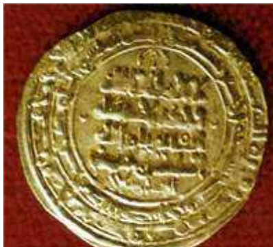
Malikşa Türkmeniň soltan Alp Arslan Türkmeniň adyna zikkeleden altyn dinary. Nusay.