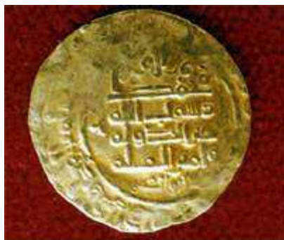
Soltan Sanjar Türkmeniň altyn dinary. Merw.

Merkezi Hemedan hasaplanýan, Kermanşahdan we Ysphyhandan durýan Günbatar Eýrany, Yragy, Palestinany we Anadolynyň guşluk tarapyny Mahmyda beren Soltan Sanjar seljuk türkmenleriniň Yrakdaky döwletini dolandyrmagyň esasy agramyny Mahmydyň üstüne ýükläpdir. Bu ýerleri edara etmekde onuň goldawçysy boljak wezipeli adamlary hem özi seçipdir. Mahmydyň özüne tabyndygyny her pursat duýup durmagy üçin Reý, Mazenderan, Kumis etraplaryny Sanjaryň özi alypdyr. Mahmydyň dört doganyna yktalar paýlap beripdir. Olardan Togrul döwletiň «Yrag'y Ajam» diýlen Jebel kysmynyň gündogar ýarpysyny hem-de «Deýlem» diýlen Gilýan welaýatyny; Seljukşa atabegi Garaja as-Saky bilen birlikde Pars welaýatyny, Ysphyhany we Huzistanyň ýarysyny alypdyr. Mulkleri şeýle usulda paýlamak bilen Soltan Sanjar Mahmydyň özüne tabynlykdan aýrylmazlygyny üpjün edip, doganlarynyň islendik pursat onuň ýerini alyp biljekdigini duýduryp goýupdyr. Emma munuň bilen döwletiň içindäki dawalary aradan aýyrmak soltan Sanjara başartmandyr.