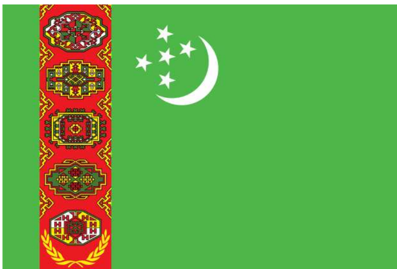
TÜRKMENISTANYŇ DÖWLET BAÝDAGY