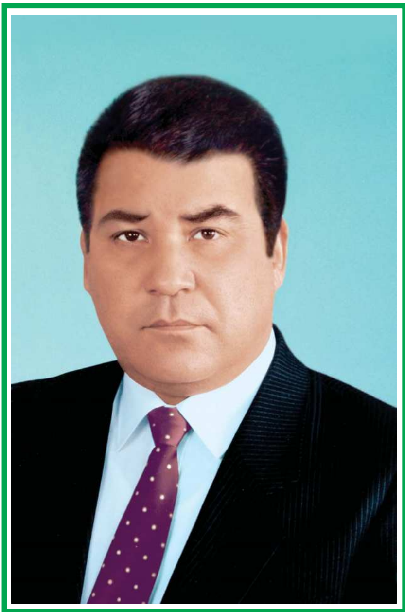
TÜRKMENISTANYŇ ILKINJI PREZIDENTI BEÝIK SAPARMYRAT TÜRKMENBAŞY