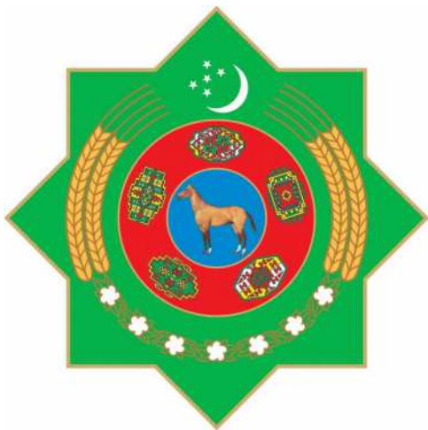
TÜRKMENISTANYŇ DÖWLET TUGRASY