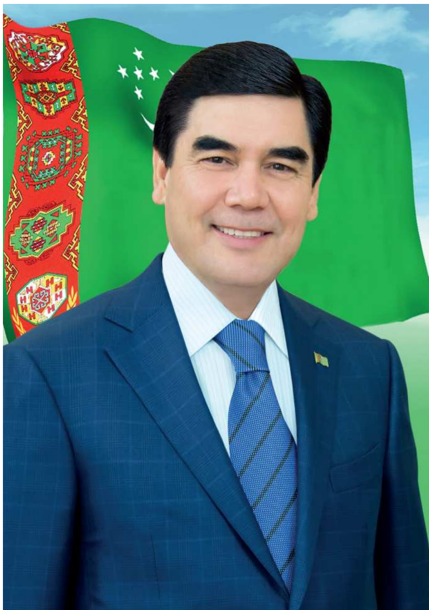
TÜRKMENISTANYŇ PREZIDENTI GURBANGULY BERDIMUHAMEDOW