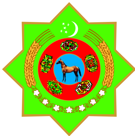
TÜRKMENISTANYŇ DÖWLET TUGRASY