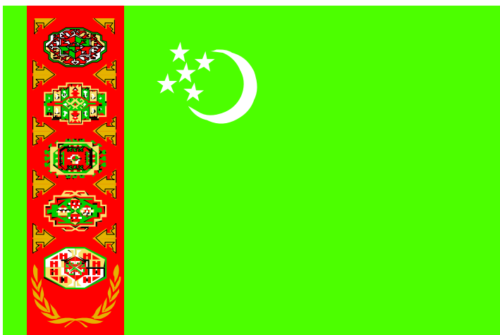
TÜRKMENISTANYŇ DÖWLET BAÝDAGY