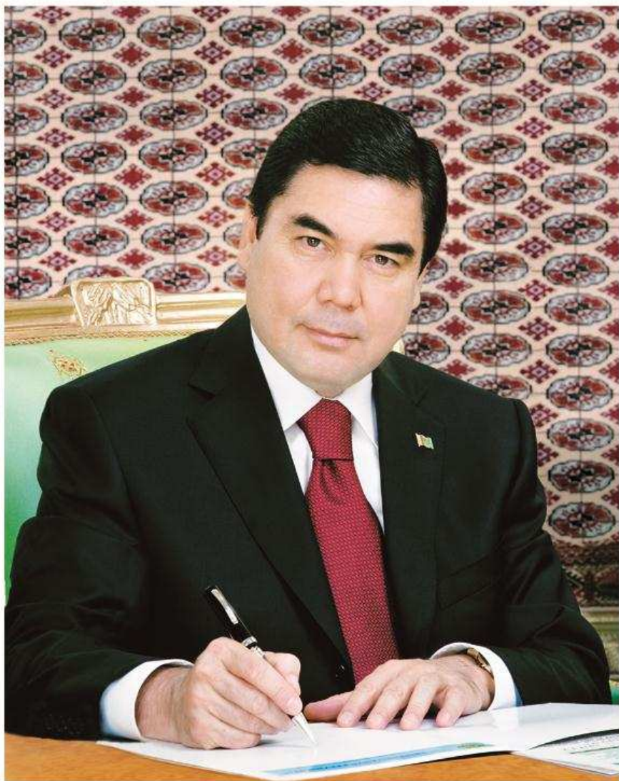
TÜRKMENISTANYŇ PREZIDENTI GURBANGULY BERDIMUHAMEDOW