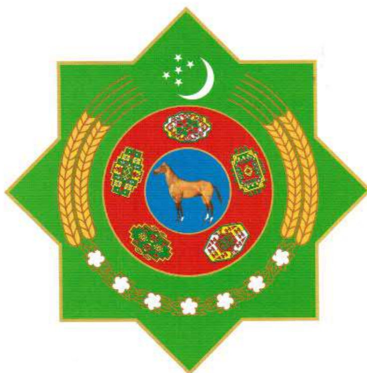
TÜRKMENISTANYŇ DÖWLET TUGRASY