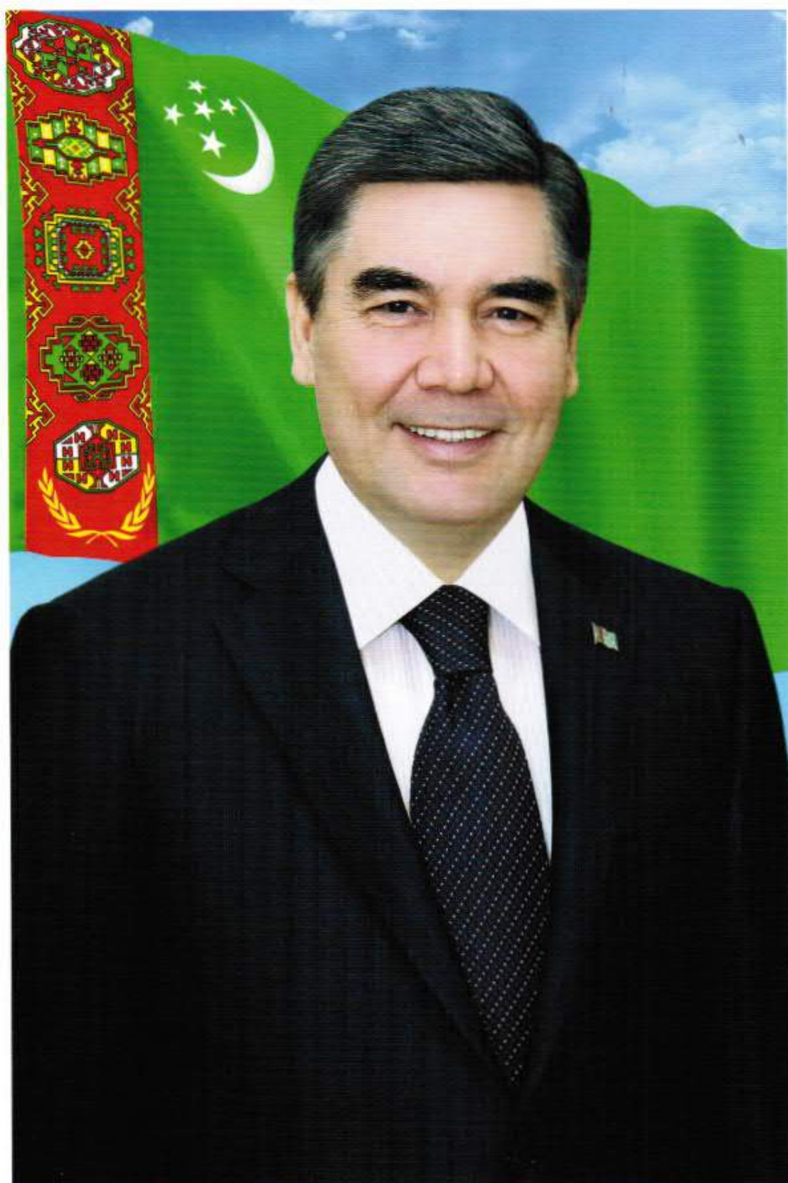
TÜRKMENISTANYŇ PREZIDENTI GURBANGULY BERDIMUHAMEDOW