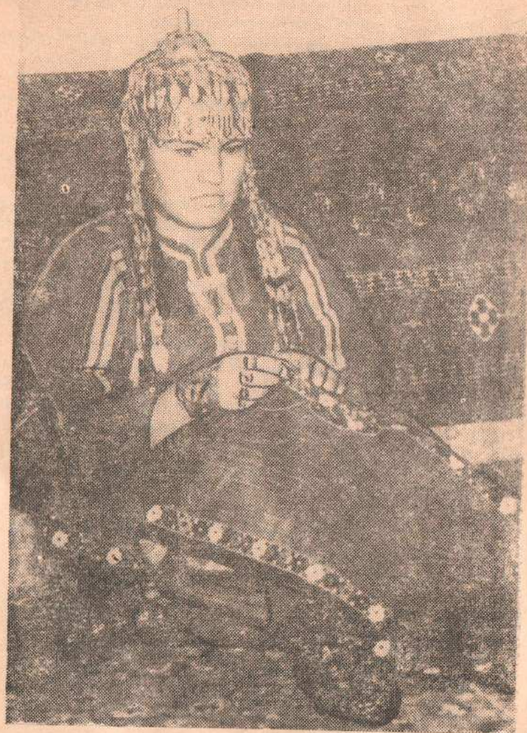
Чепер элли гыз.