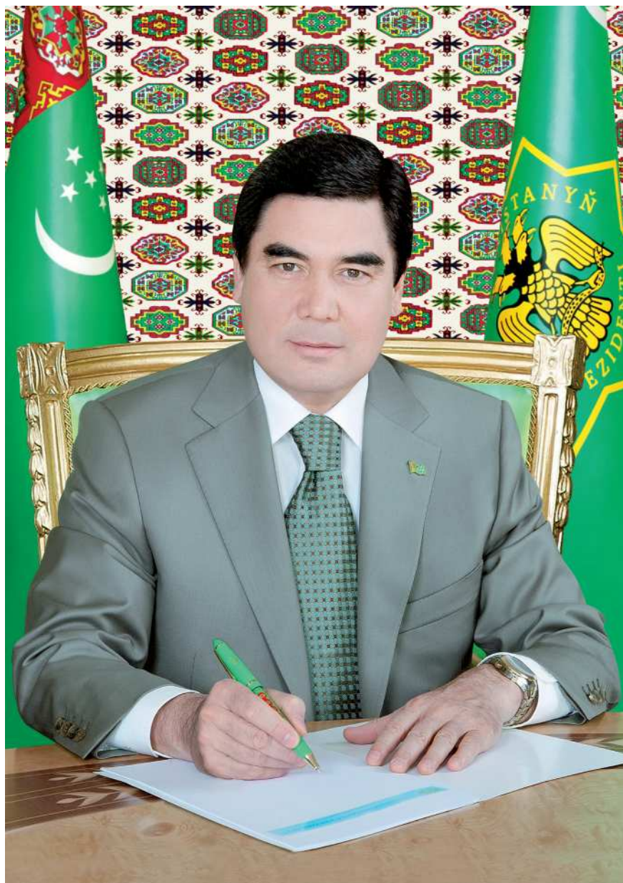
TÜRKMENISTANYŇ PREZIDENTI GURBANGULY BERDIMUHAMEDOW