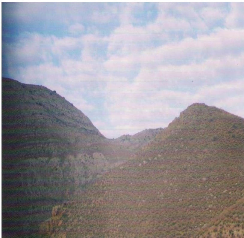
3-nji surat. Köse dag

Dekdurmazalaň – Köneürgenç etrabynda etrabyndaky depe ýol, ýolagçylary köplenç basmaçylaryň talandygy üçin oňa şeýle at berilipdir.