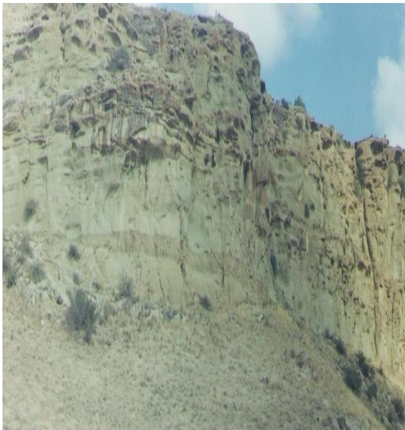
7-nji surat. Gorgan (gala)

Olar çöl çöplerinden, daşlardan ýa-da palçykdan konus görnüşinde dikeldilip, uzakdan görner ýaly ýerlerde: beýiklikleriň, depeleriň üstünde oturdylar.