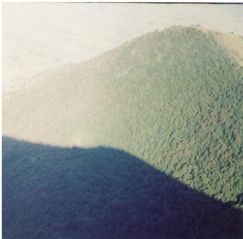
4-nji surat. Hasar dag.

diýen geografik termini “gündogardan öwüsýän güýçli ýel” diýip terjime edilýär.