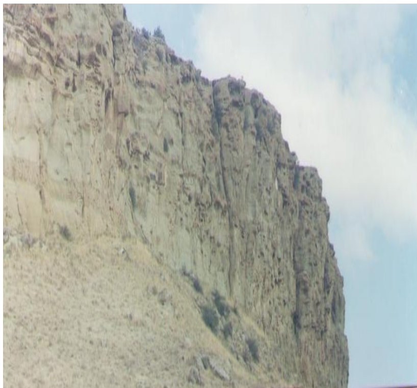
8-nji surat. Gorgan (gala)

Zäwlijedag- gazanjyk etrabynda zäw diýen ota baý dag.