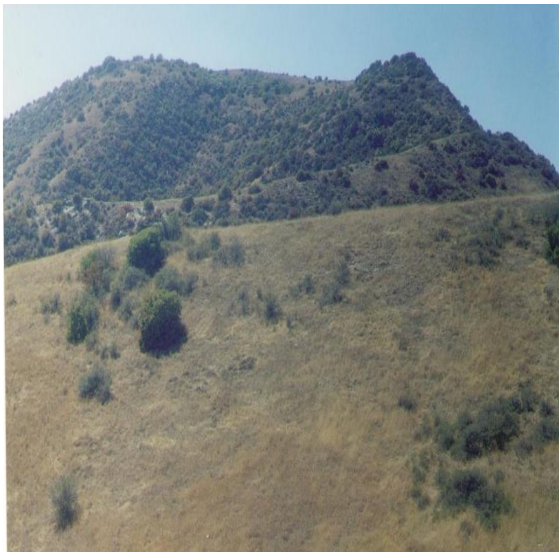
5-nji surat. Hasar dag.

Üçguýy –Garagumda sany boýunça üç guýusy bolan dag.