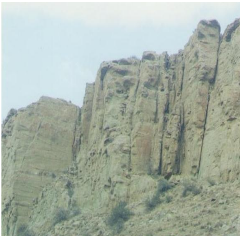
2-nji surat. Gorgan (gala)