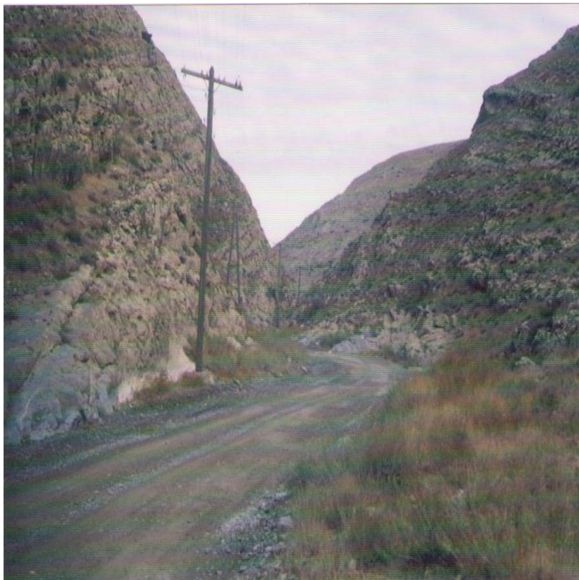
6-nji surat. Dag gädigi.

görnüşi. ÝGG, ýañy-ýakyna çenli, şol ýerde äpet söwüt bar eken.