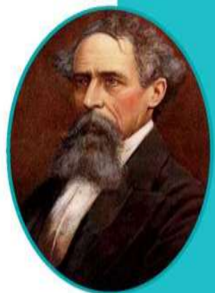
ÇARLZ DIKENS (1812 — 1870)

Çarlz döredijilik ýoluna juwan ýaşlarynda aýak basypdyr. 1836-njy ýylda «Bozuň oçerkleri» atly ilkinji kitaby çap edilende, eýýäm onuň ýazarynyň ady okyjylaryň köpüsine bellidi. Hakyky şöhrat Dikense «Pikwik jemgyýetiniň miras galan ýazgylary» (1836-1837) kitaby çap edileninden soň gel-ýär. Dünýä edebiyatynyň iň göwün galkyndyryjy eserleriniň biri hasaplanýan bu eserde ýazyjy birnäçe ýatdan çykmaýan keşpler döretmegi başarypdyr. Ondan soňky döreden eserleri, şol sanda «Oliwer Twistiň başdangeçirmeleri» (1838), «Nikolas Niklbi» (1839), «Martin Çezwit» (1843), «Dombi we ogly» (1848), «Dewid Kopperfild» (1849-1850), «Iki şäher hakda hekaýat» (1859) we «Uly umytlar» (1860) romanlary Dikens aýatda diri gezip ýören wagty hem dünýä edebiyatynyň näýba-şy eserleri hasaplanýardy.